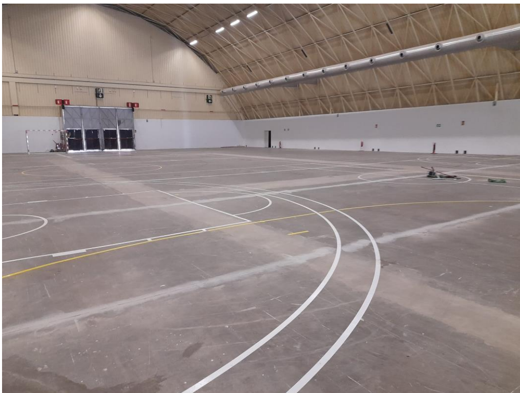
02. Fotografia interior Pavelló / 2023-09-22