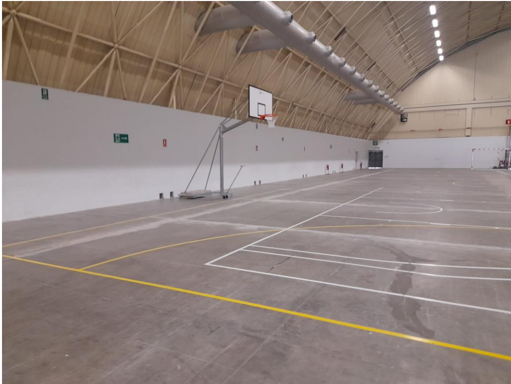
01. Fotografia interior Pavelló / 2023-09-22