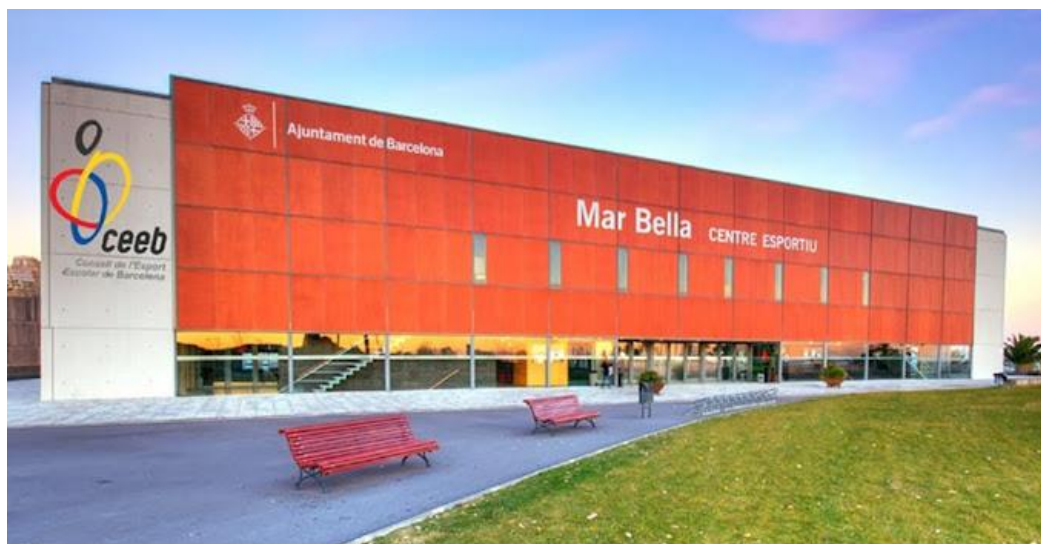
Imatge 1. Imatge del CEM Mar Bella, edifici objecte del projecte.