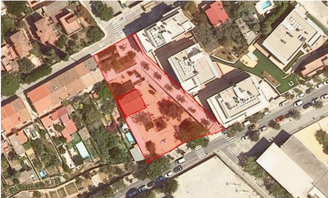
Ortofoto de localització

L'objecte del present contracte inclou una participació activa en el procés fins a la seva aprovació definitiva.