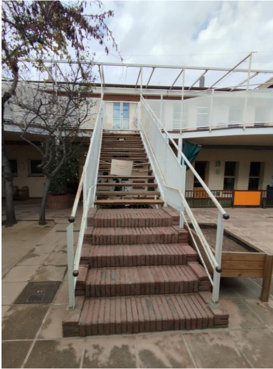
Escala, vista 3