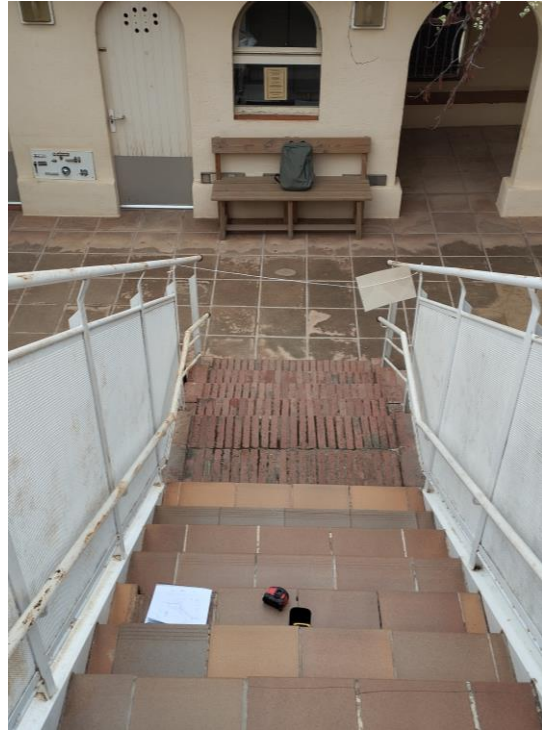
Escala, vista 4