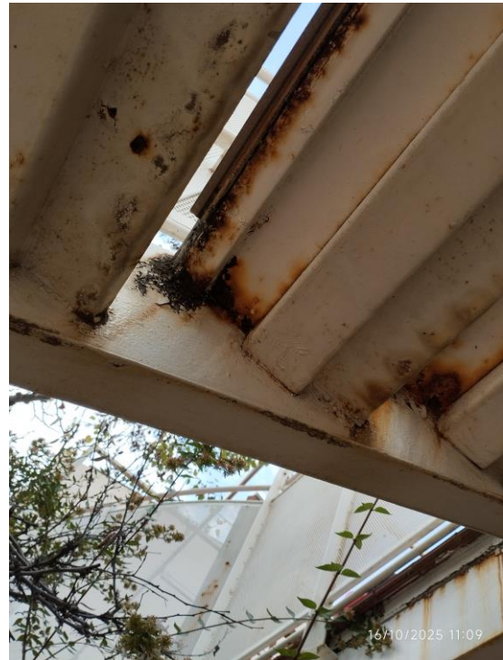
Escalera, vista 7