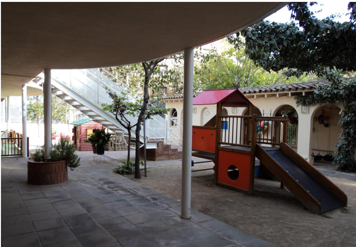
Escala, vista 1