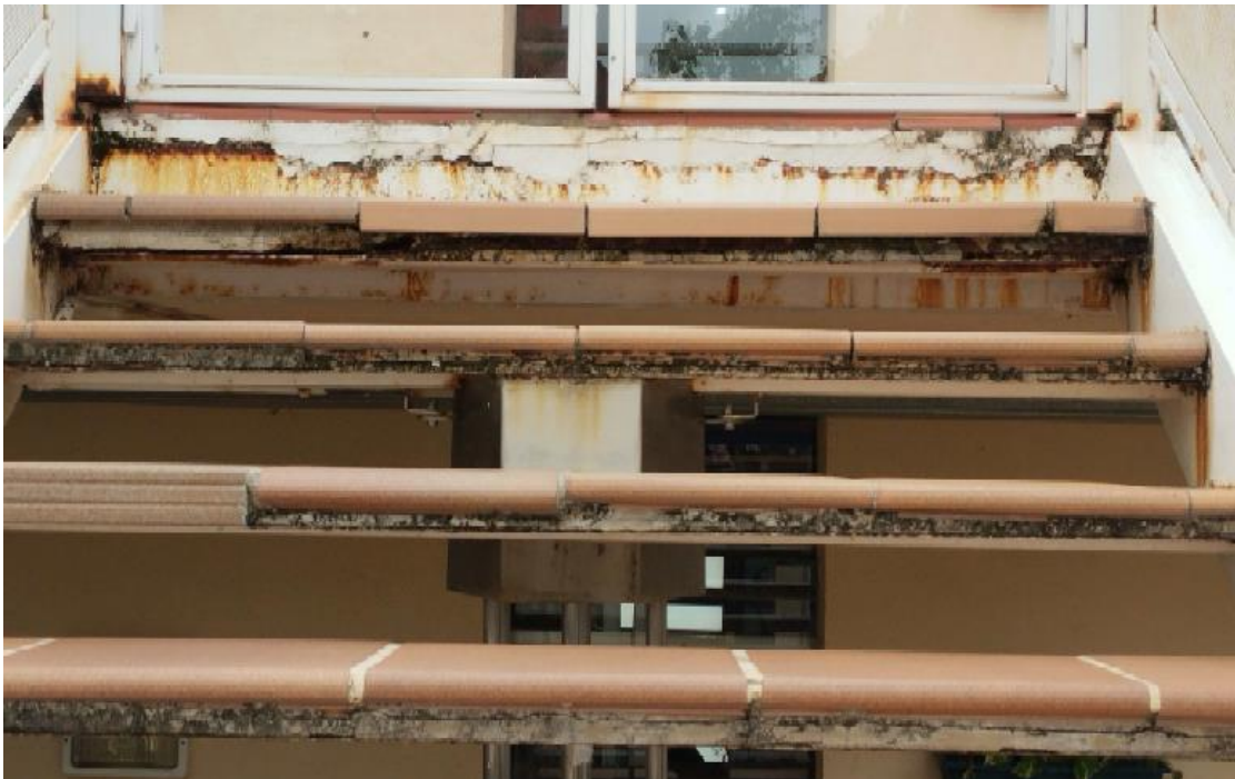
Escala vista 5