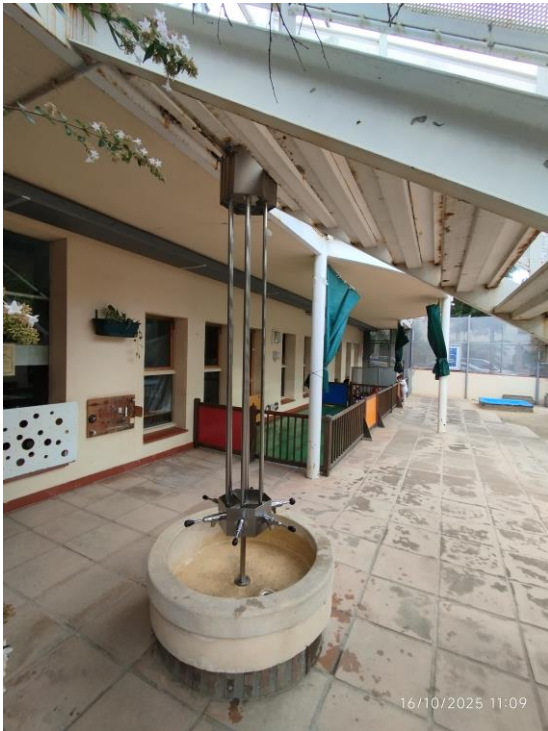
Escalera, vista 6