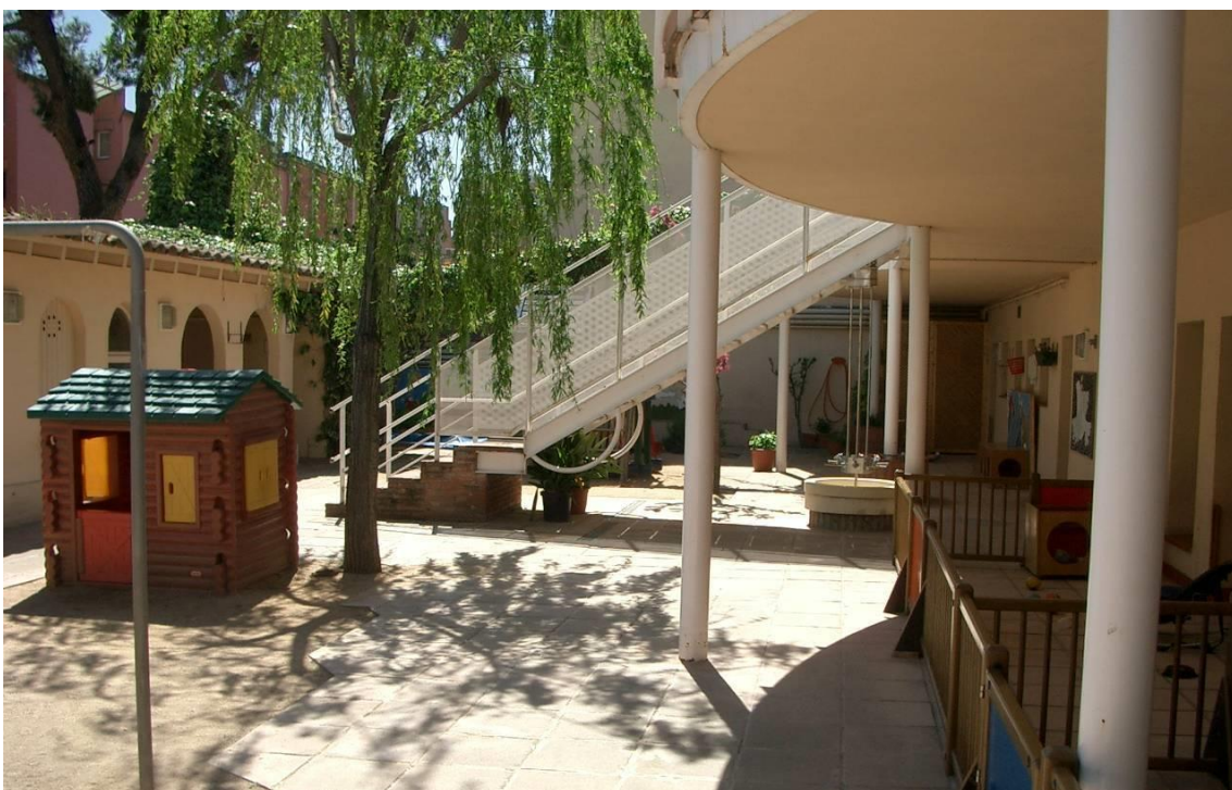
Escala vista 2