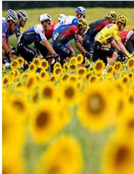
Font oficial (ASO)

Cerca de 490 000 PARTICIPANTES en los desafíos Strava del Tour de Francia y de sus socios