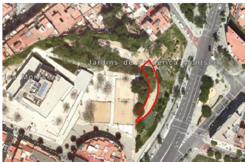
Vista aèria de l'AEG de Frederica Montseny

A l'àrea s'hi accedeix pel nord des d'unes escales que venen des del carrer de Vinyals i des de les escales que venen de la plataforma superior dels Jardins Frederica Montseny. Pel sud s'arriba bé des de la rampa que ve del carrer de Feliu o bé des de l'escala que ve de plataforma superior dels mateixos Jardins.