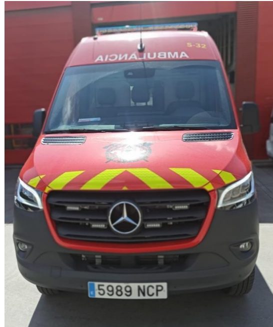
IMATGE FRONTAL FINAL: