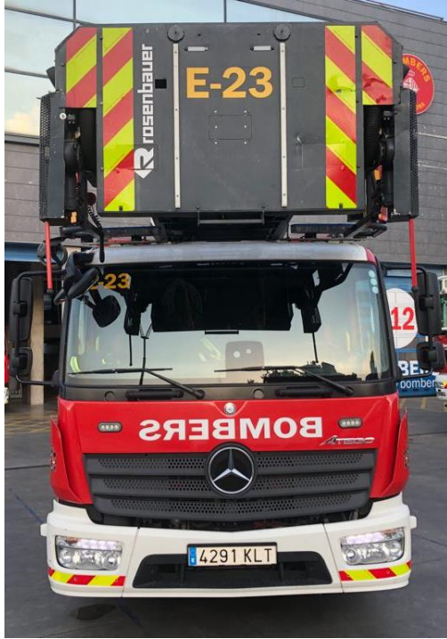
IMATGE FRONTAL ACTUAL: