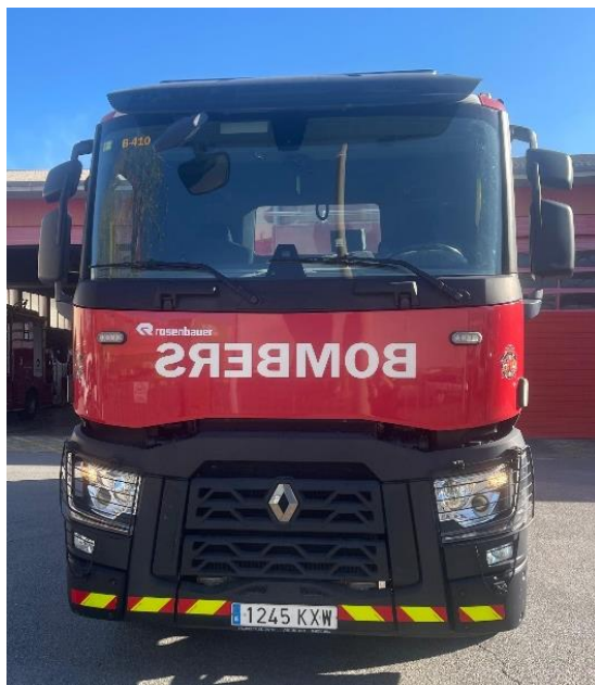
IMATGE FRONTAL ACTUAL: