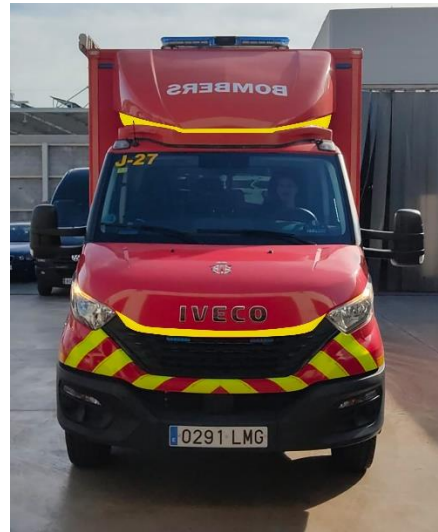
IMATGE FRONTAL FINAL: