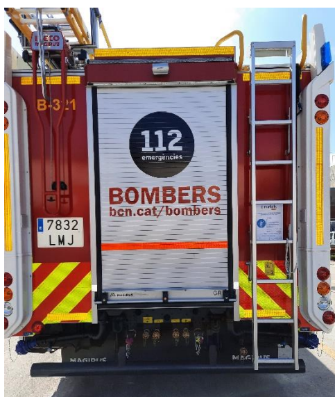
IMATGE FRONTAL ACTUAL: