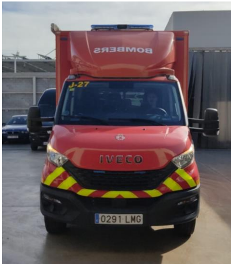
IMATGE FRONTAL ACTUAL: