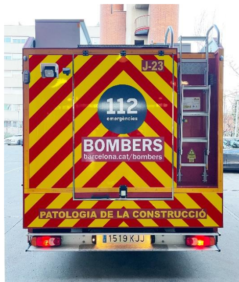
IMATGE POSTERIOR FINAL: