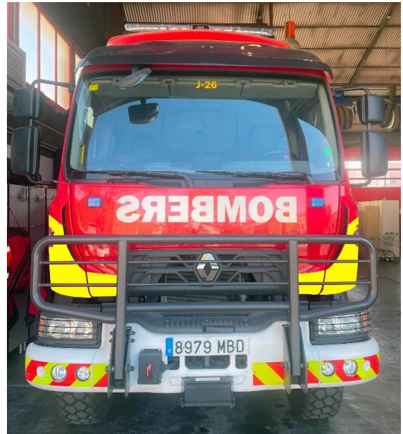
IMATGE FRONTAL FINAL: