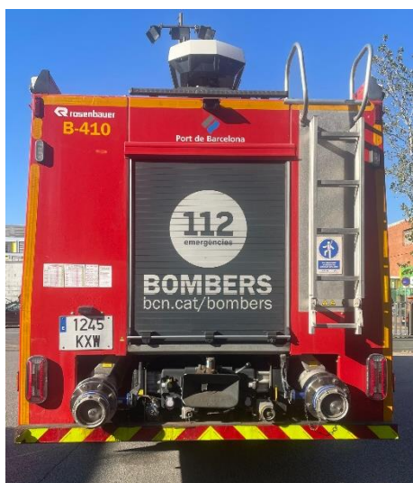
IMATGE POSTERIOR ACTUAL: