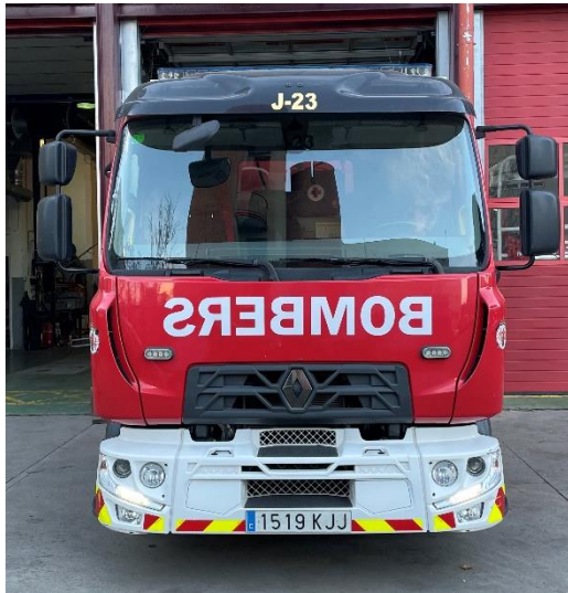
IMATGE FRONTAL ACTUAL: