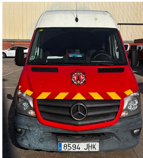
IMATGE FRONTAL FINAL: