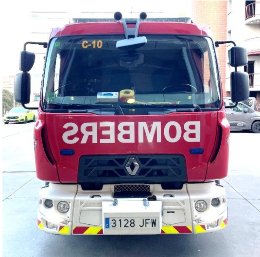
IMATGE FRONTAL ACTUAL: