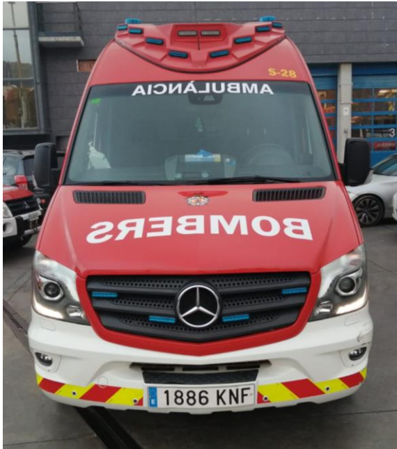
IMATGE FRONTAL ACTUAL: