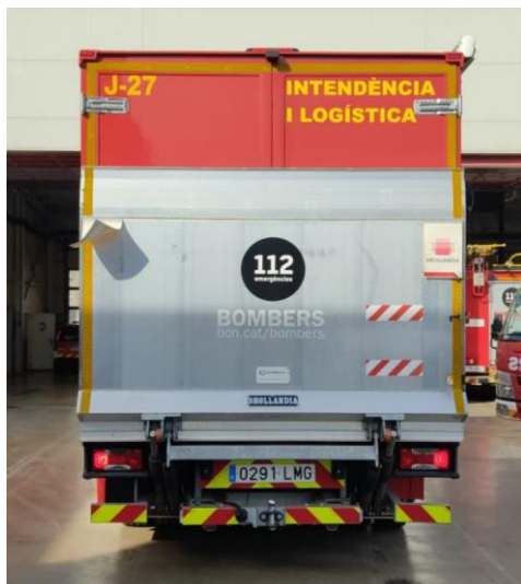
IMATGE POSTERIOR ACTUAL: