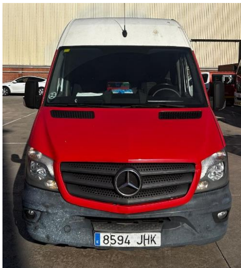
IMATGE FRONTAL ACTUAL: