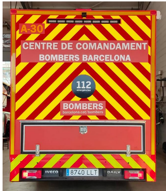
IMATGE POSTERIOR FINAL: