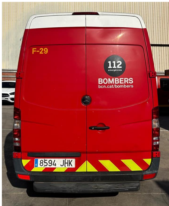
IMATGE POSTERIOR ACTUAL: