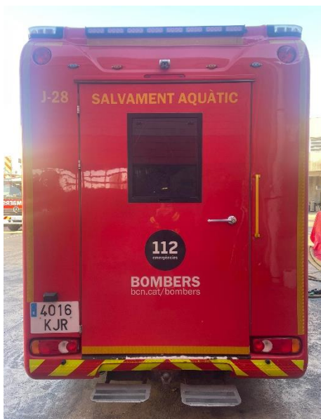
IMATGE POSTERIOR ACTUAL: