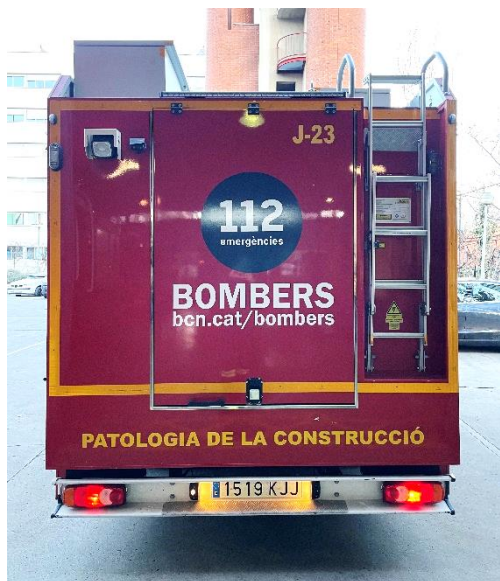
IMATGE POSTERIOR ACTUAL: