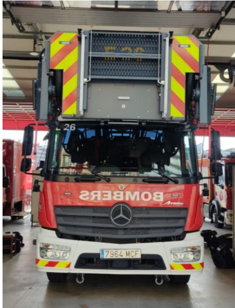
IMATGE FRONTAL ACTUAL: