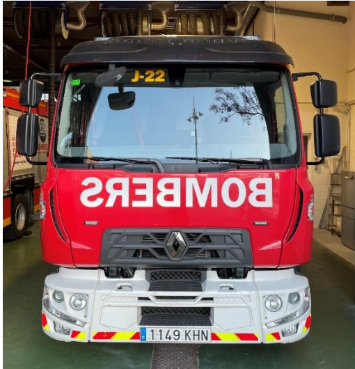
IMATGE FRONTAL ACTUAL: