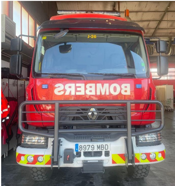
IMATGE FRONTAL ACTUAL: