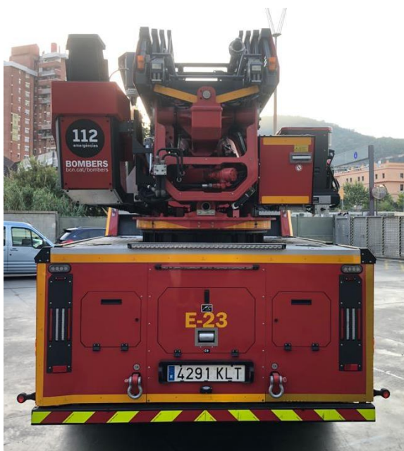
IMATGE POSTERIOR ACTUAL: