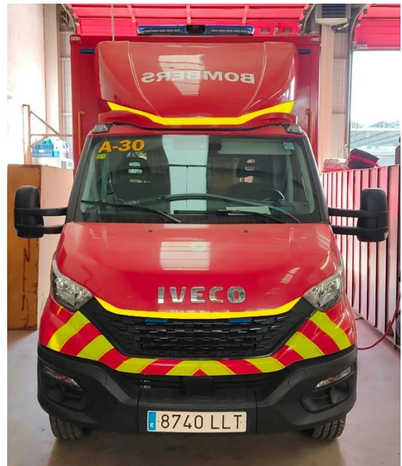
IMATGE FRONTAL FINAL: