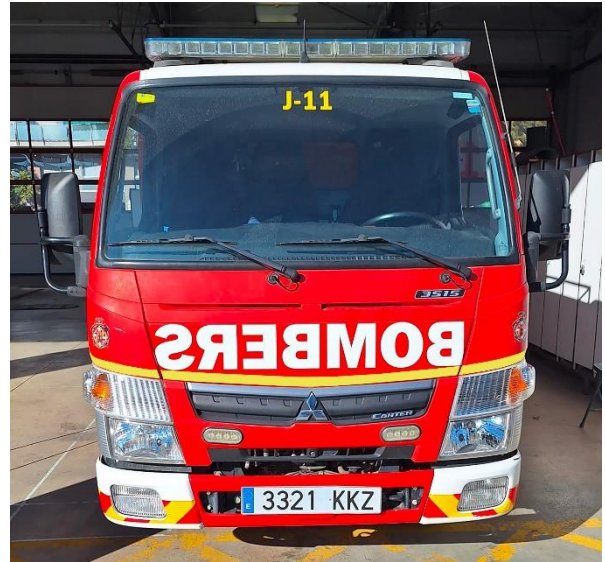
IMATGE FRONTAL FINAL: