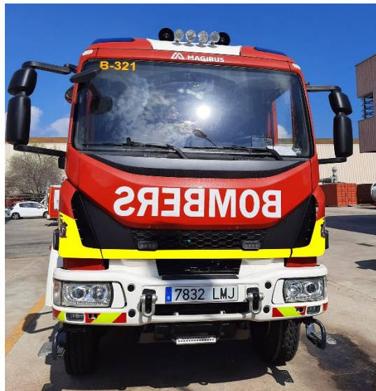
IMATGE FRONTAL FINAL: