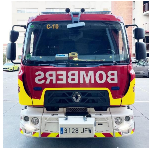
IMATGE FRONTAL FINAL: