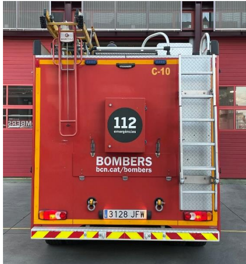
IMATGE POSTERIOR ACTUAL: