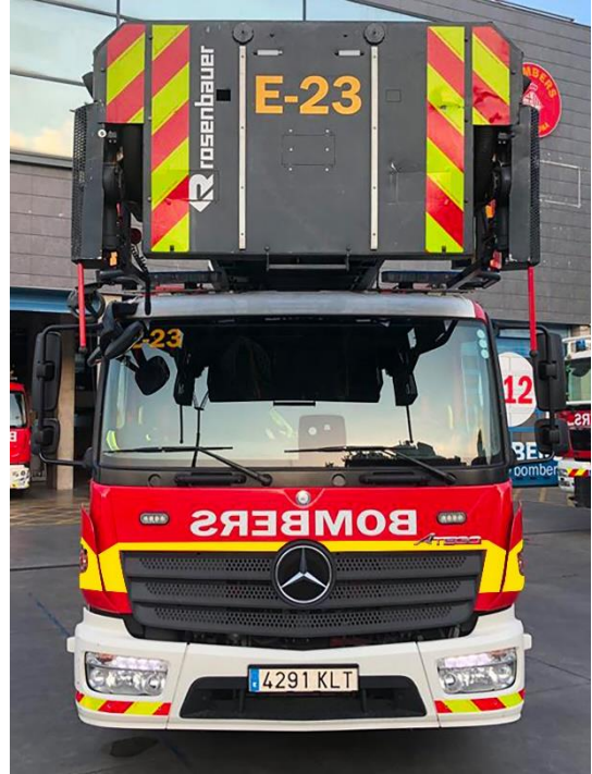
IMATGE FRONTAL FINAL: