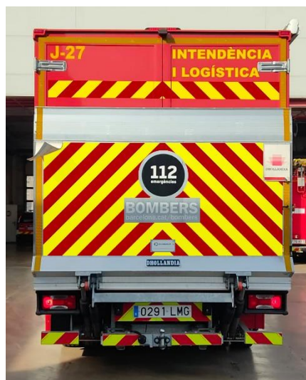
IMATGE POSTERIOR FINAL: