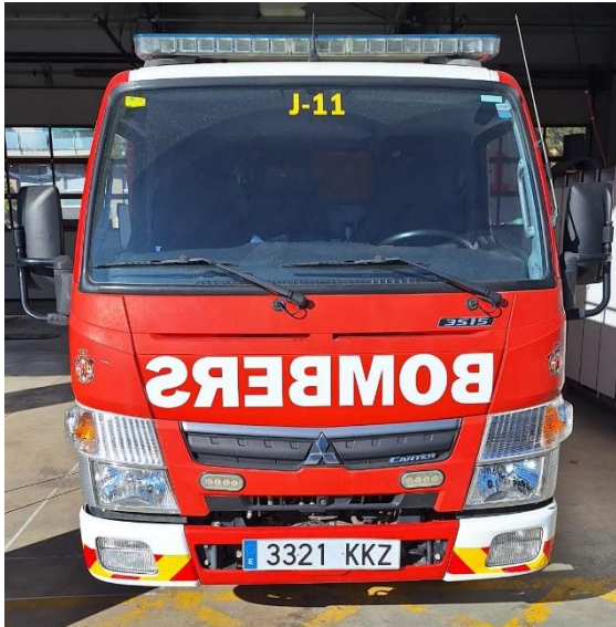
IMATGE FRONTAL ACTUAL: