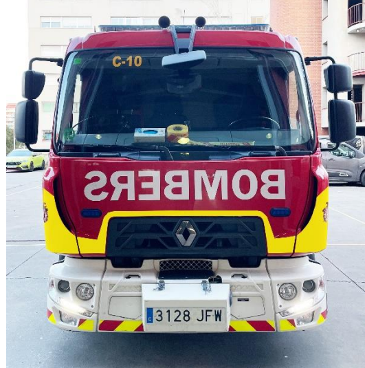
IMATGE FRONTAL FINAL: