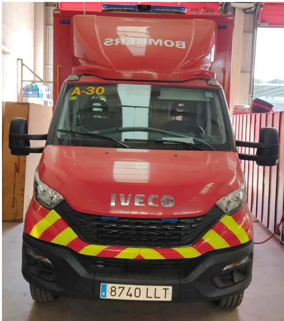
IMATGE FRONTAL ACTUAL: