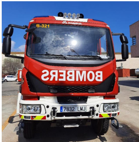
IMATGE FRONTAL ACTUAL: