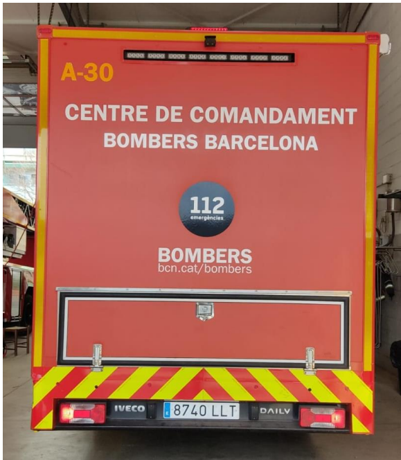
IMATGE POSTERIOR ACTUAL: