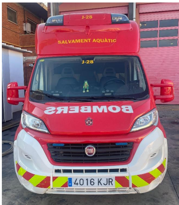
IMATGE FRONTAL ACTUAL: