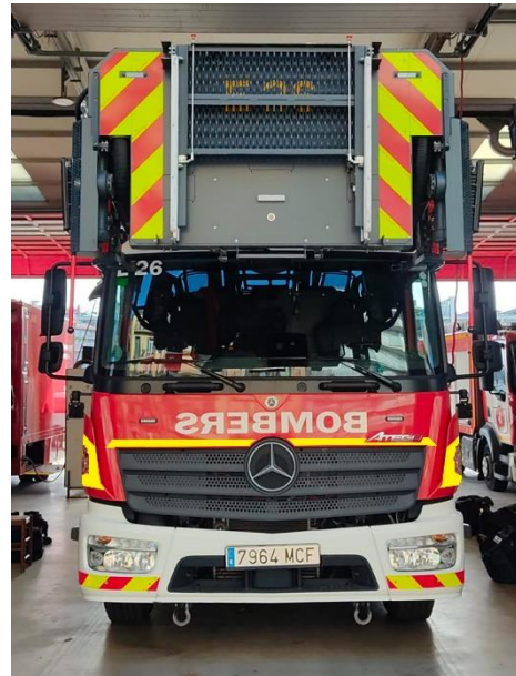
IMATGE FRONTAL FINAL: