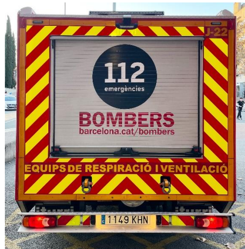
IMATGE POSTERIOR FINAL: