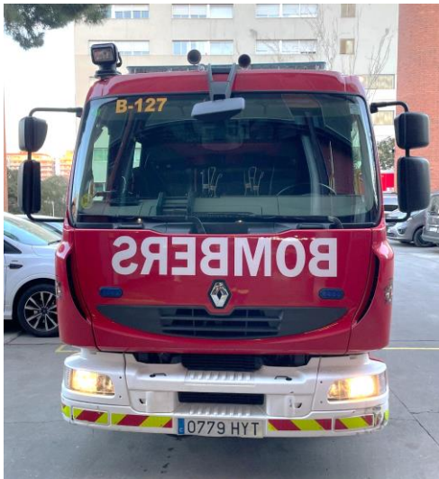
IMATGE FRONTAL ACTUAL: