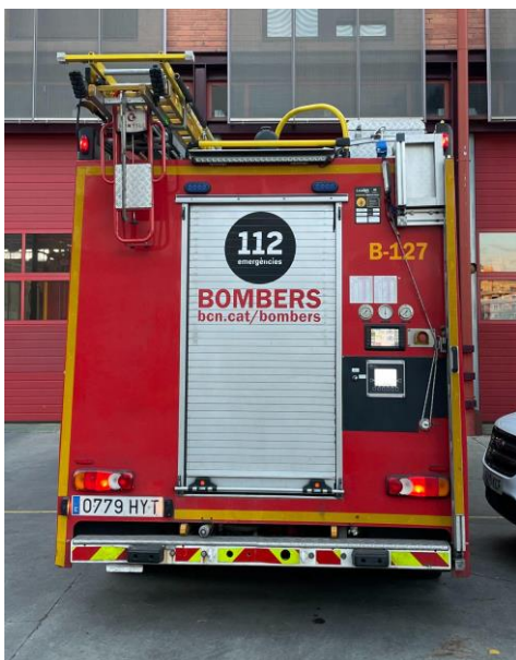
IMATGE FRONTAL ACTUAL: