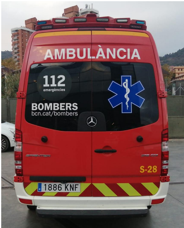
IMATGE POSTERIOR ACTUAL: