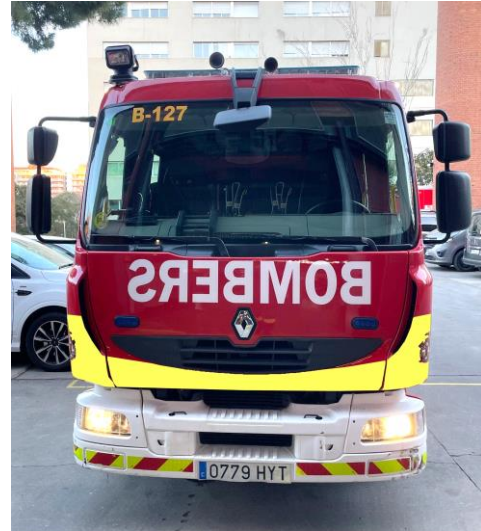
IMATGE FRONTAL FINAL: