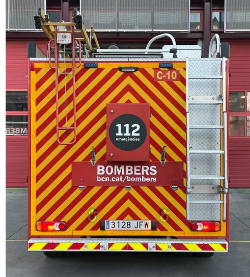
IMATGE POSTERIOR FINAL: