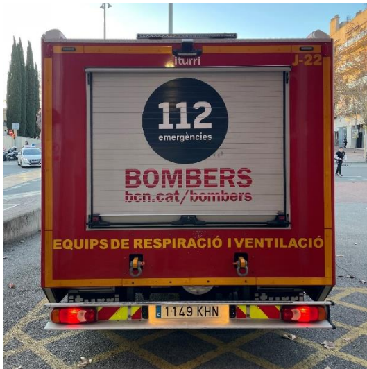
IMATGE POSTERIOR ACTUAL: