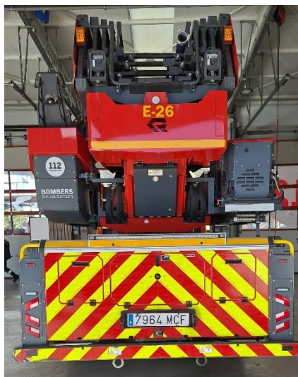
IMATGE POSTERIOR ACTUAL: