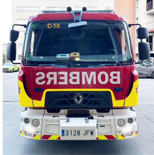
IMATGE FRONTAL FINAL: