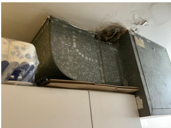
Caixa de ventilació

Substitució de variador de freqüència per adaptar-lo a la potència del nou motor.