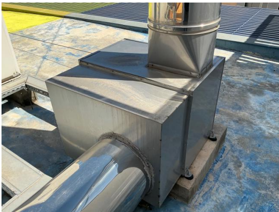
Caixa de ventilació

Reparació i segellat de juntes del conducte.