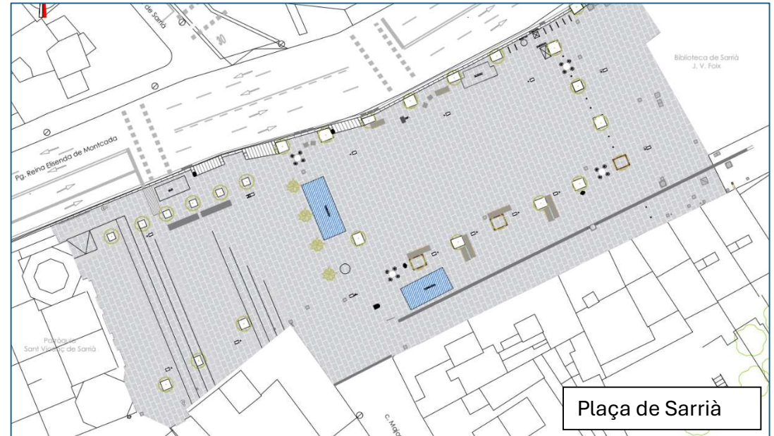
Plaça de Sarrià