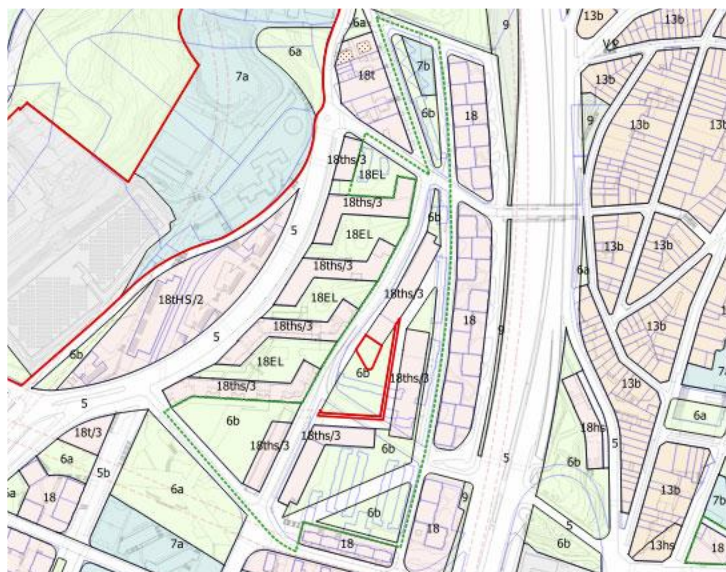
Imatge 1: puntejat en verd, perímetre de l'àrea d'intervenció del PERI de la Trinitat Nova (UA 3)

Complementàriament, s'espera que el servei també sigui d'utilitat per als professionals que treballen a la Trinitat Nova, molt especialment els dels equipaments i serveis de caire comunitari, de manera que els faciliti l'enxarxament en el desenvolupament de la seva activitat professional. A més, també caldrà implicar equipaments, serveis, entitats, grups més o menys formals i fins i tot veïnes a títol individual en la construcció i el desenvolupament de les accions d'acollida, mitjançant la creació dels espais de treball i seguiment necessaris i específics.