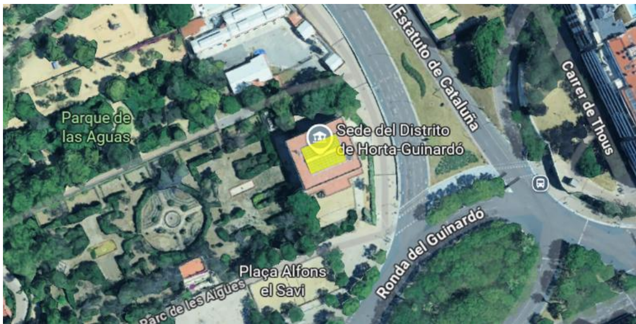
Vista aèria equipament d'actuació.

Les obres consisteixen en la "Instal·lació d'una sèrie de tendals tipus vela per la SEU del districte d'Horta-Guinardó com a finalitat d'esmorteir l'impacte tèrmic que actualment provoca la coberta fotovoltaica de vidre existent.