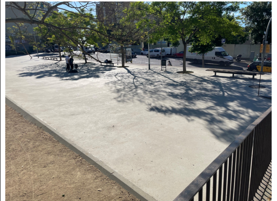
Pl. Toni Roca Estat actual

Elements actuació (estimació).....6 pilars + superfície coberta de 130m2