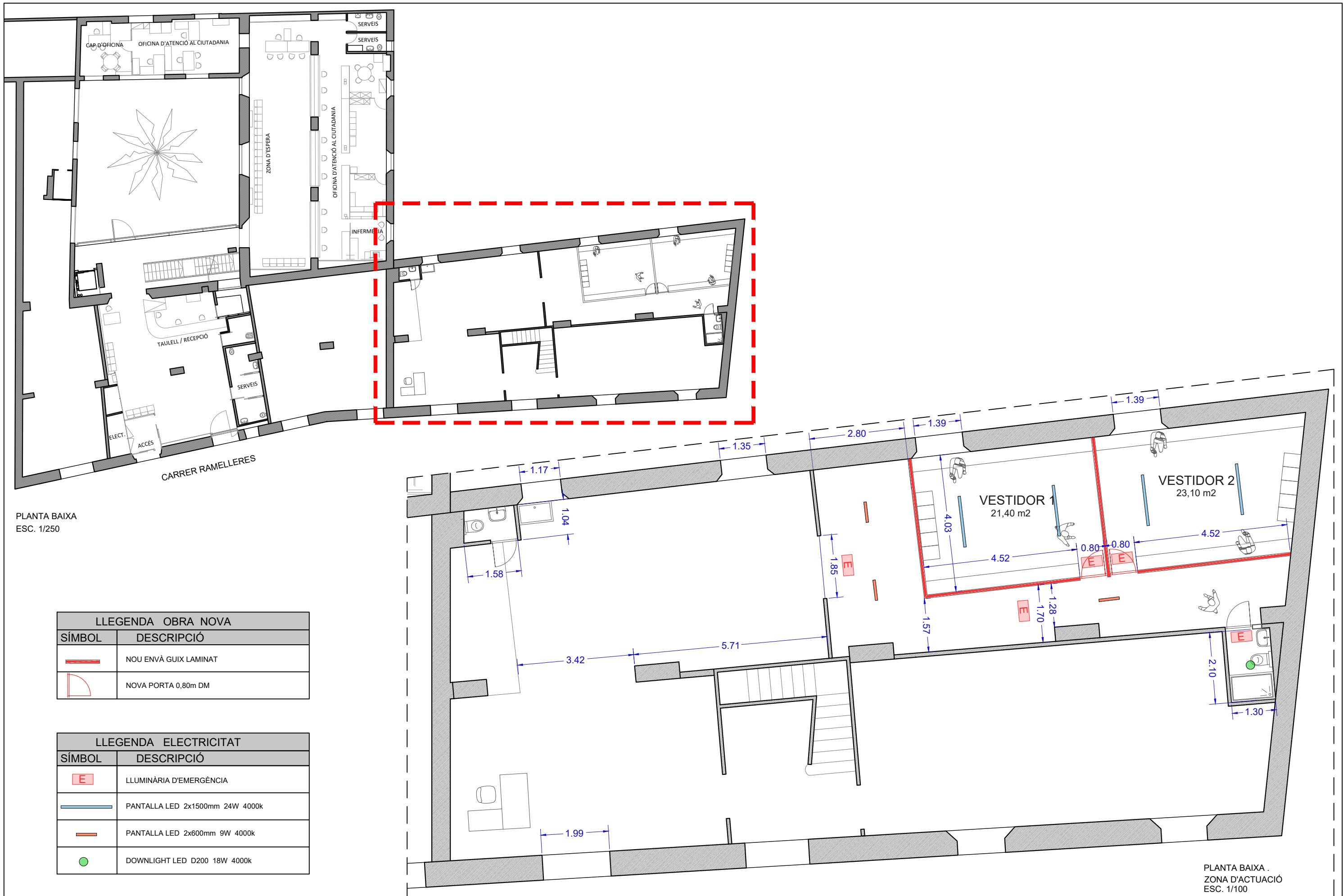
PLANTA BAIXA ESC. 1/250