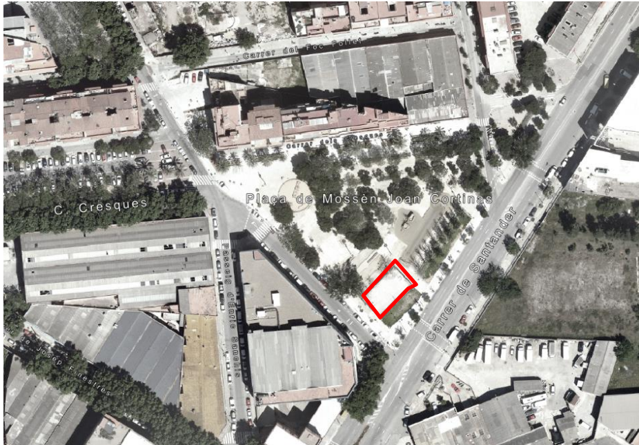
Vista aèria emplaçament pça. Mossèn Cortines