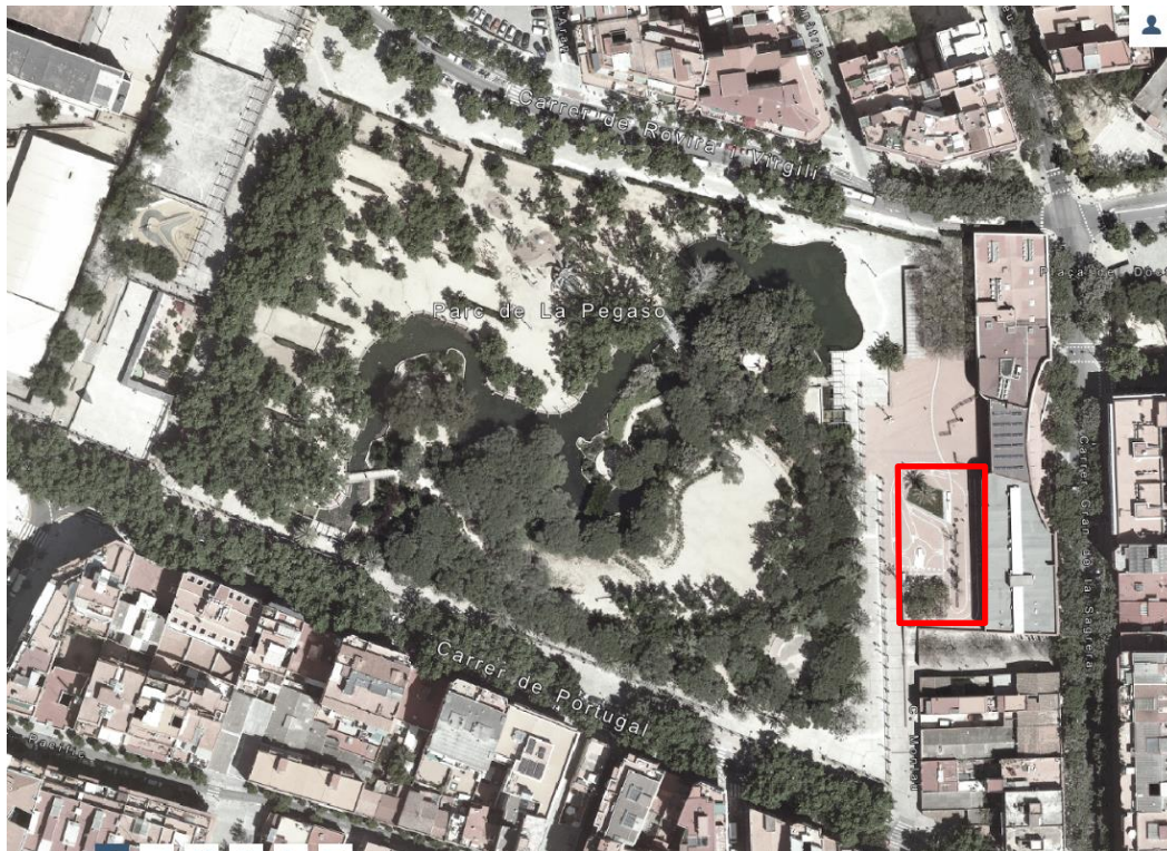
Vista aèria emplaçament Parc de la Pegaso