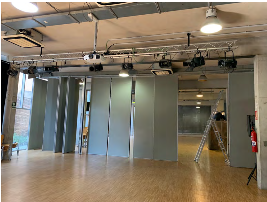
▲ Vista general de la Sala Polivalent, amb els focus a substituir.