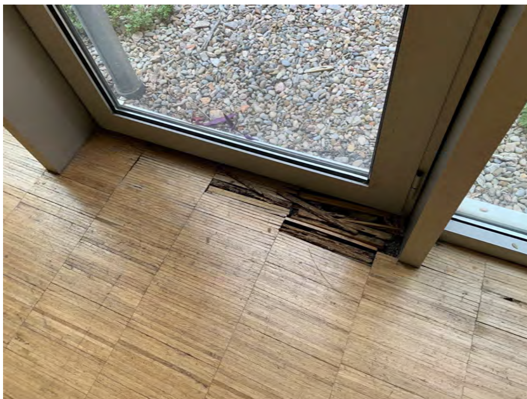
▲ Detall paviment de parquet en mal estat.