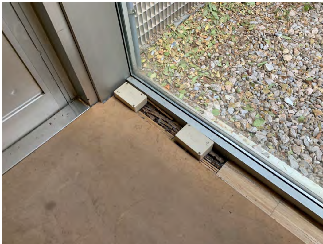
▲ Detall paviment de parquet en mal estat.