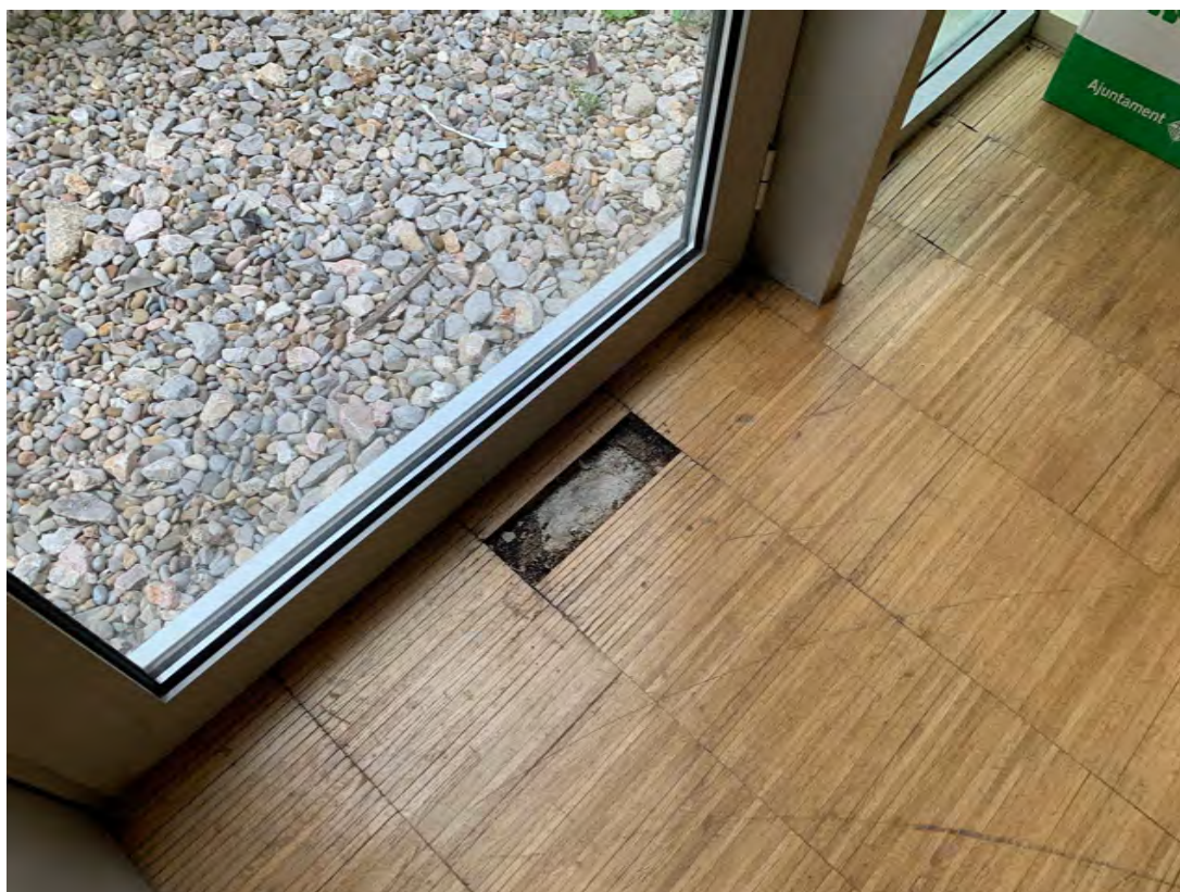
▲ Detall paviment de parquet en mal estat.