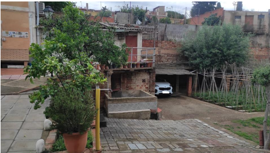
Vista interior. Enderroc coberts i construccions.