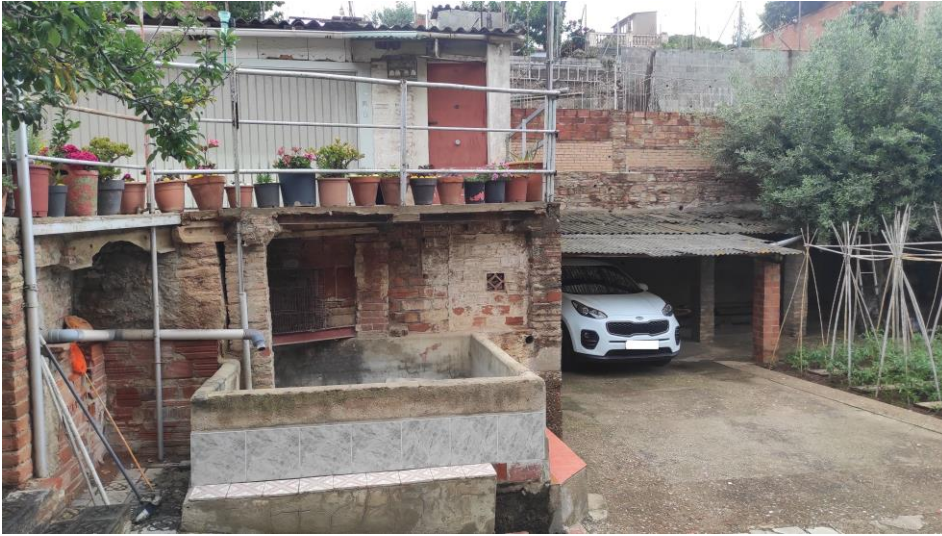
Vista interior. Enderroc coberts i construccions.