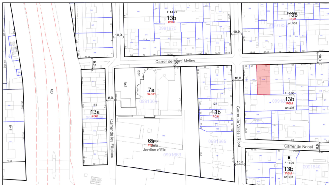
2 Emplaçament Centre Cívic La Sagrera - La Barraca

L'immoble data de l'any 1980 segons cadastre. Es tracta d'una construcció entre mitgeres, amb façana principal al carrer Martí Molins, i façana posterior a pati d'illa; part de les parets mitgeres laterals, les d'afectació d'aquest projecte donen a patis interiors de les finques contigües. L'edifici te una superfície construïda de 903 m2 distribuïts en una planta baixa i tres plantes pis. A la planta baixa es troba la recepció i el teatre; a la planta primera la sala d'exposicions i diverses sales d'entitats i altres activitats; a la planta segona l'aula de manualitats, la sala polivalent, aula de cuina i sala de reunions; i a la planta tercera la direcció i el taller d'arts.