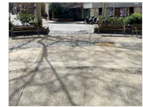
Paviment i bancs actuals