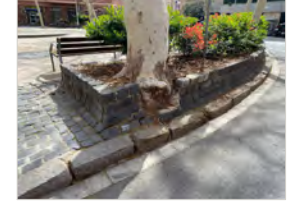
Afectacions de l'arbrat en les jardineres