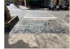
Guals d'accés actuals