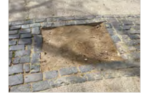
Escocells on manca arbrat