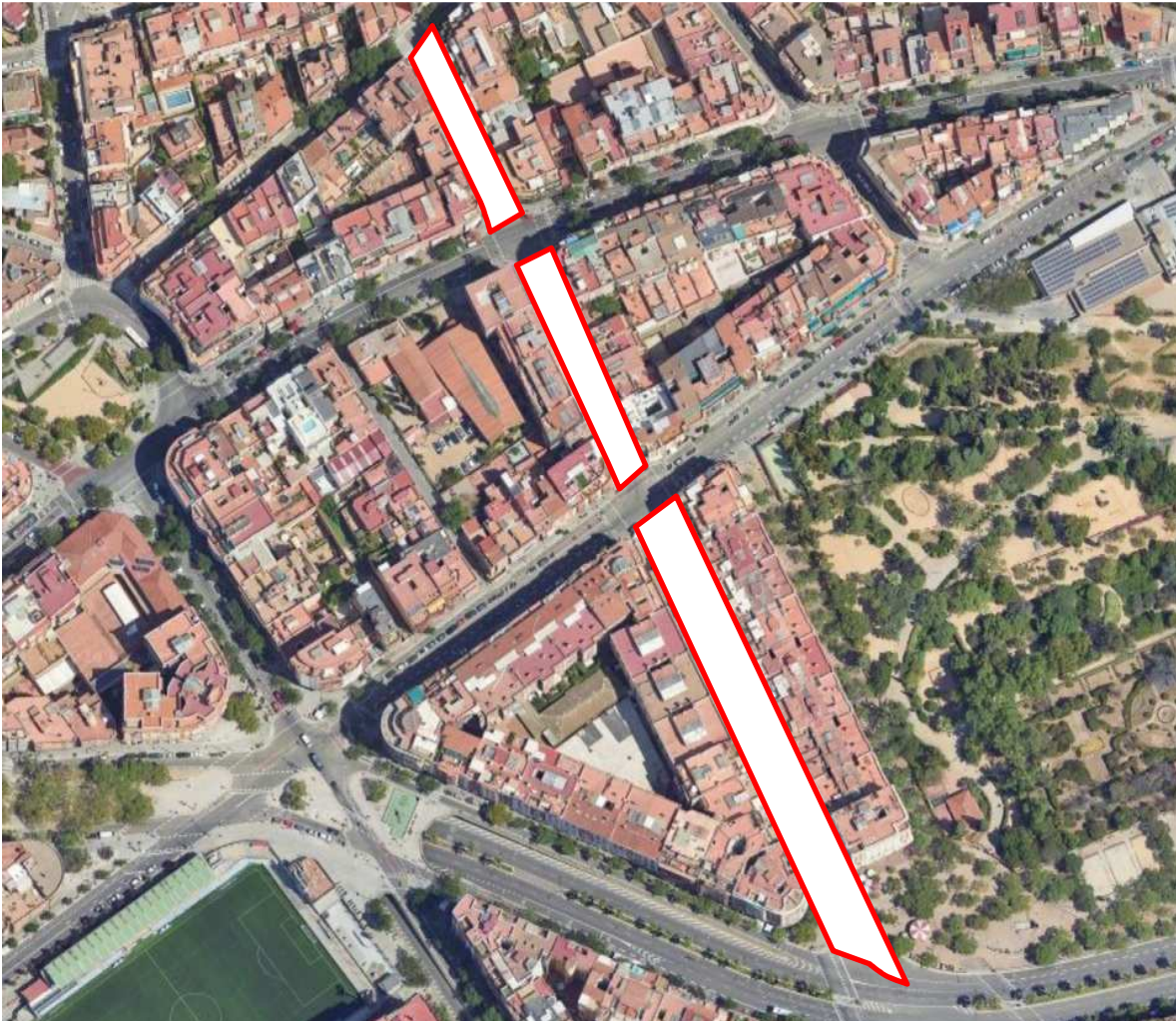
Vista aèria i zona d'actuació.