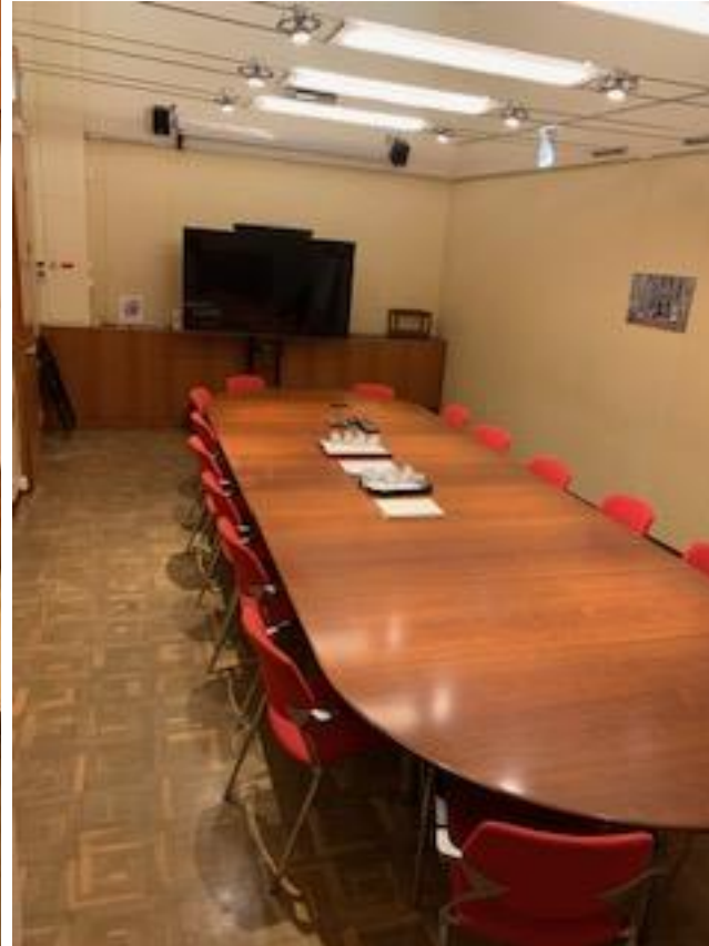
Planta Baixa: Sala de Junes, cal polir i encerar el parquet existent, per deixar-lo en perfecte estat