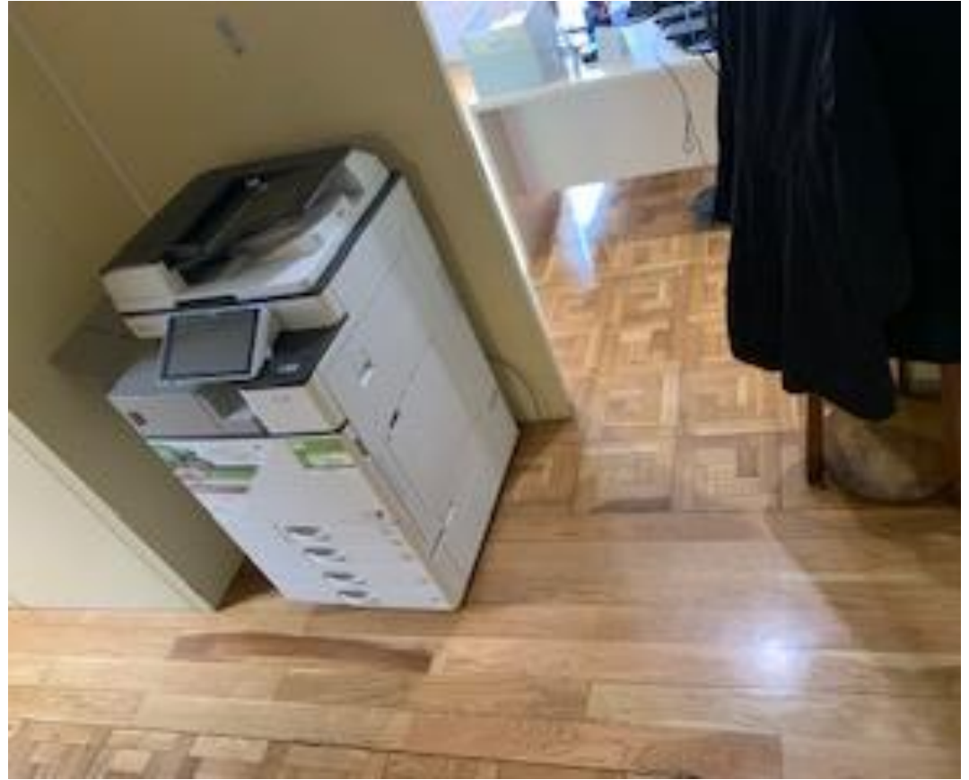
Planta Primera: Distribuidor oficines, cal substituir la franja lineal per peces de parquet de fusta iguals a les existents.