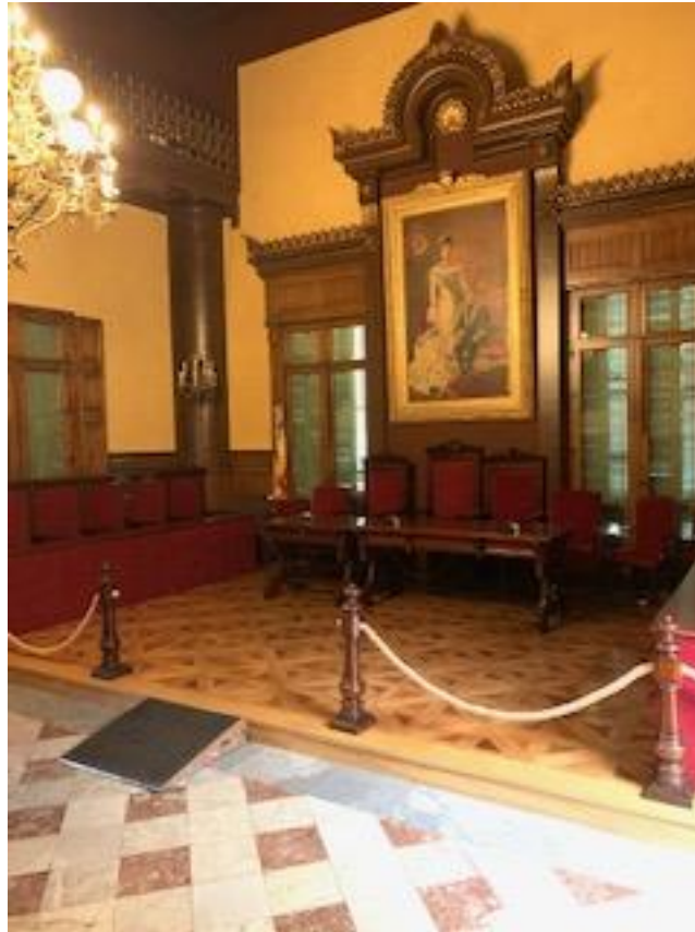
Planta Primera: Sala de Plens, cal polir i encerar el parquet per deixar-lo en perfecte estat.