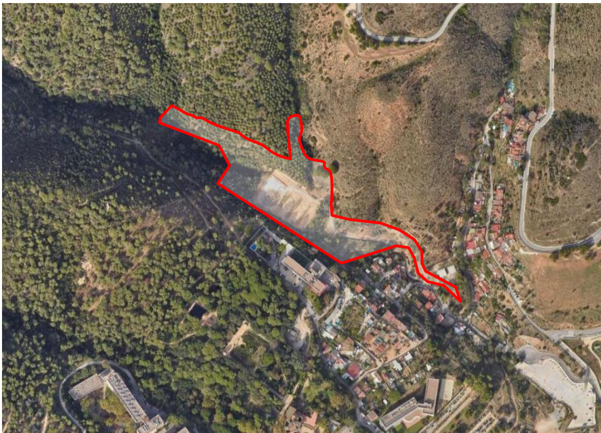
Vista aèria i zona d'actuació.