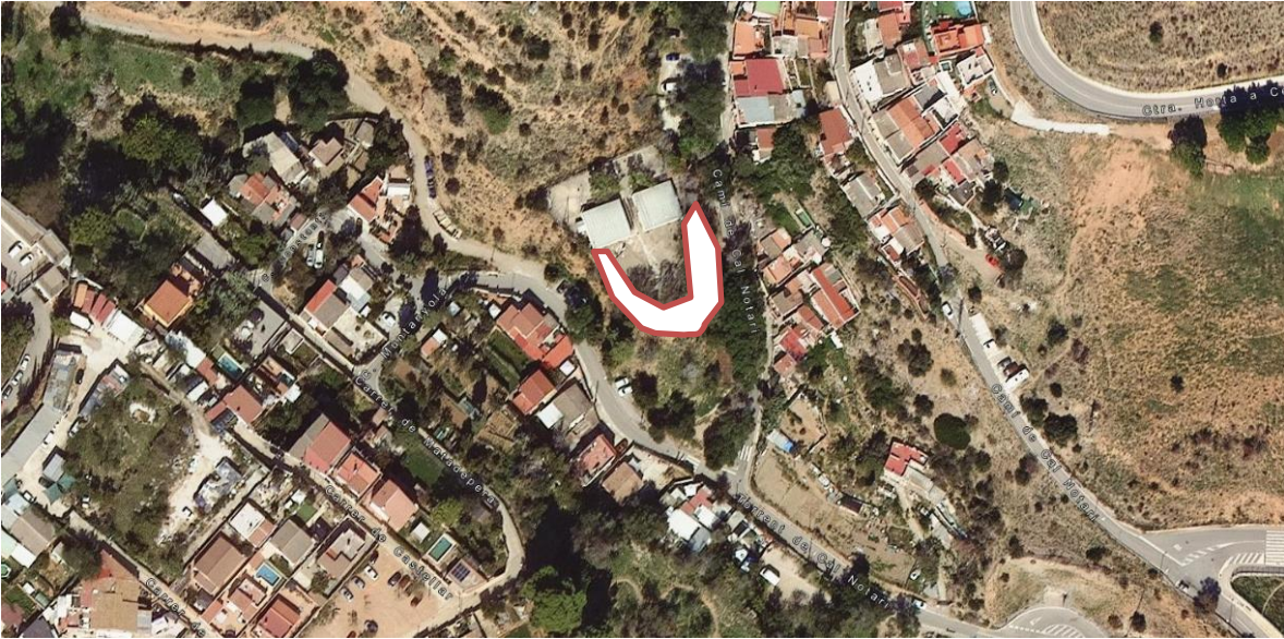
Vista aèria i zona d'actuació.