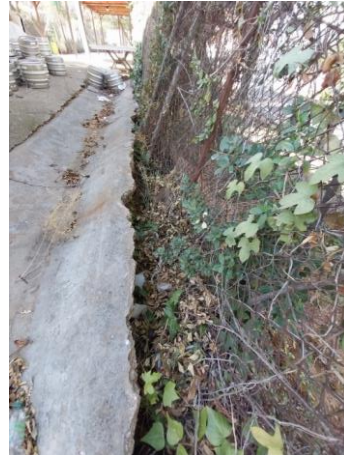
Reixa de simple torsió pati de petanques.