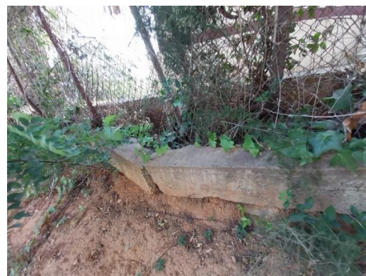
Fonamentació superficial Camí de Cal Notari.