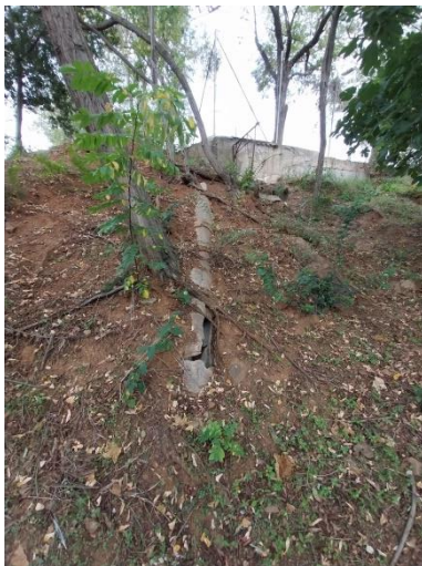
Canonada de sanejament, de formigó, a substituir