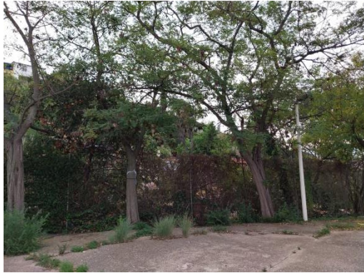
Pati de petanques