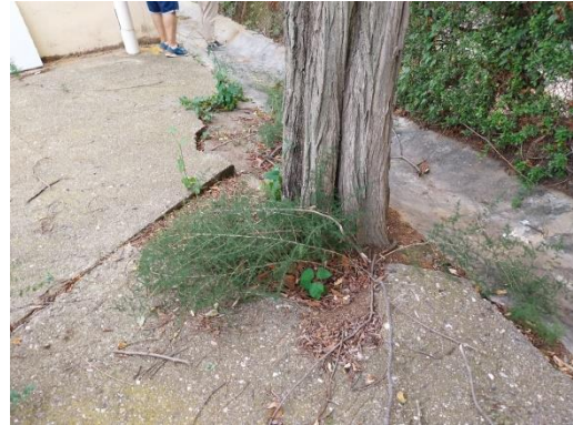
Estat general del pati de petanques. Paviments aixecats per les arrels