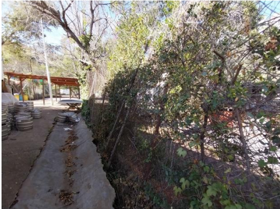
Reixa de simple torsió pati de petanques.