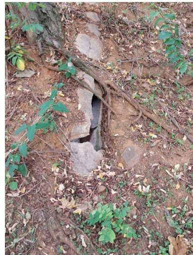
Canonada de sanejament, de formigó, a substituir.