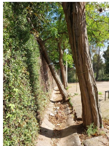
Arbres a eliminar