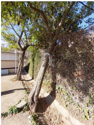
Arbres a eliminar .