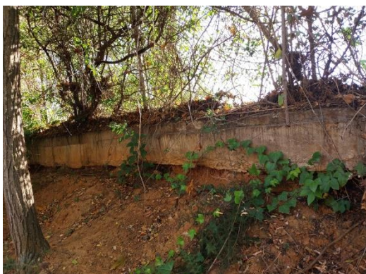
Fonamentació superficial Camí de Cal Notari.