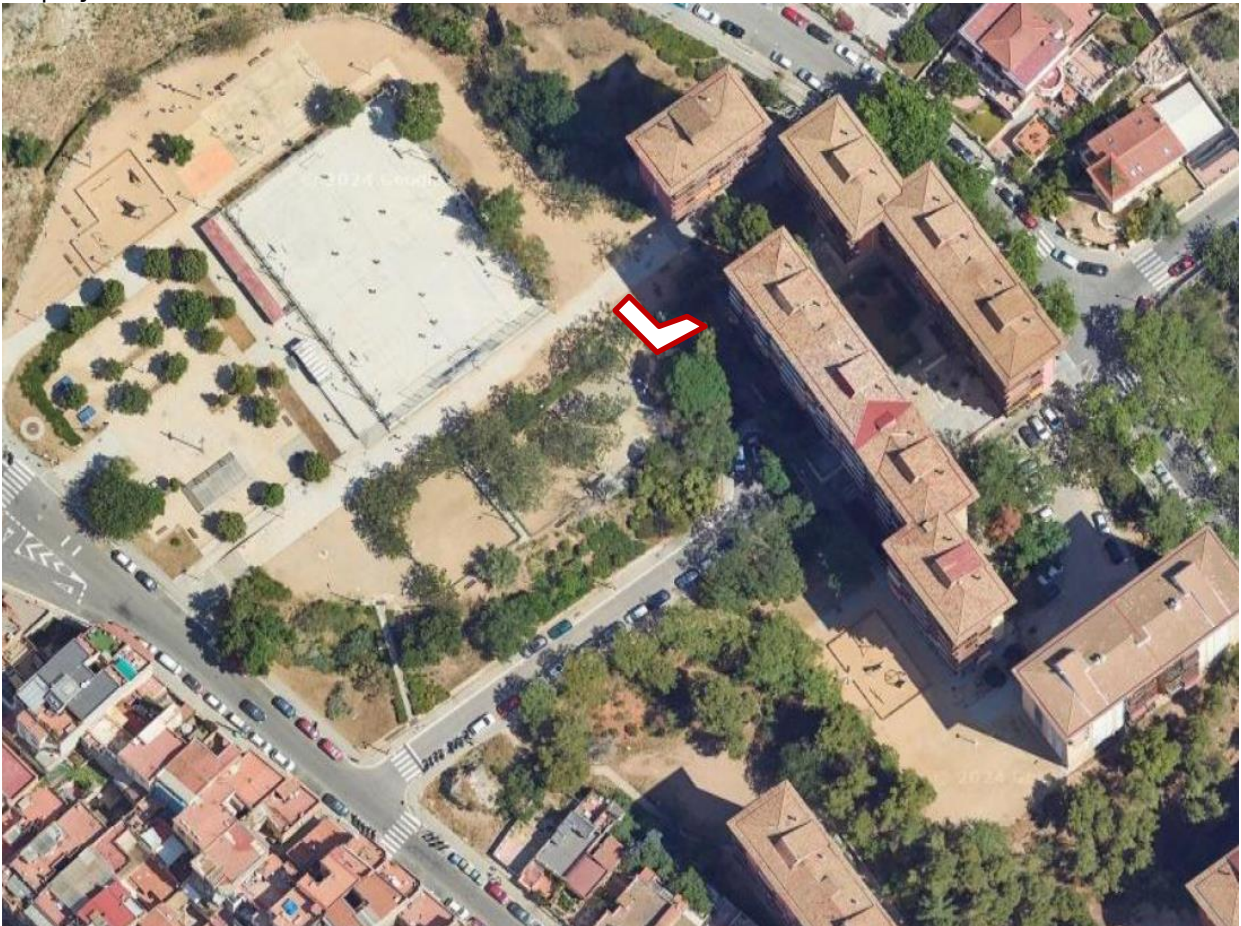
Vista aèria i zona d'actuació.