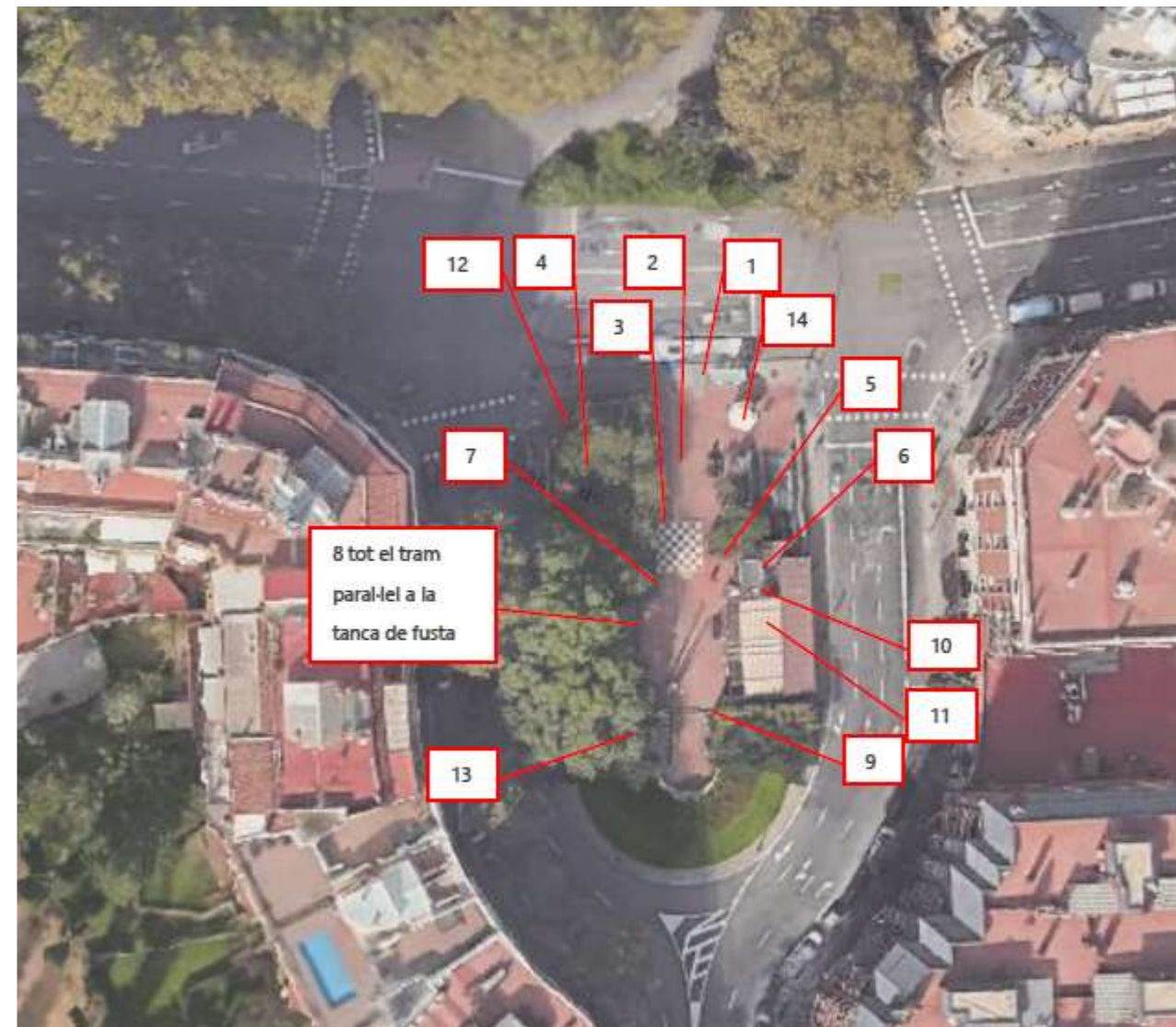
CROQUIS UBICACIÓ PUNTS PAVIMENT PER ARRANJAR