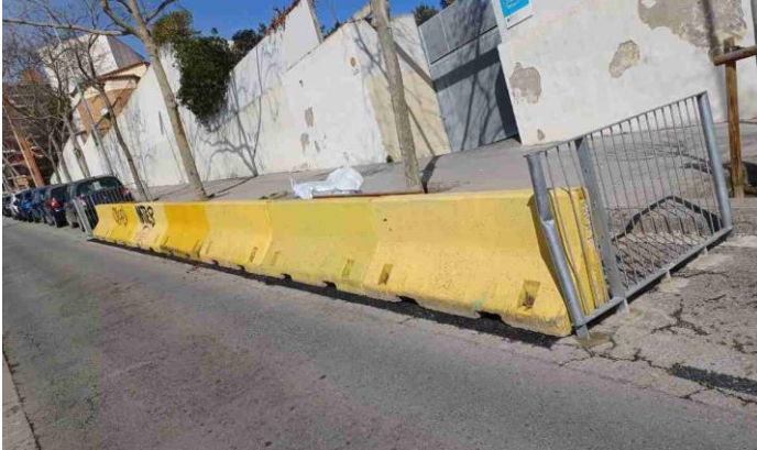
Fotografia de l'entorn escolar, març 2025

Atès les incidències produïdes, es proposa la retirada dels dos trams de barana existents i de la totalitat de les barreres de formigó, i col·locar de nou la barana inicialment instal·lada, amb la mateixa tipologia de i modulatge de barana.