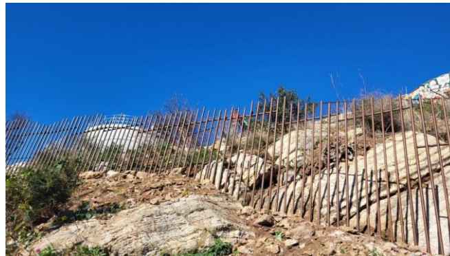
Imatge tancament perimetral existent

A tot el perímetre de la bateria antiaèria del Carmel existeix un tancat perimetral que permet poder gestionar els accessos i el tancament de l'espai museístic. Actualment aquest tancament presenta alguns punts dèbils i d'altres vandalitzats, inclosos en un informe emès per part de Guàrdia Urbana. En aquest informe es detecten dos punts pels quals accedeixen els visitants de manera irregular, i que suposen relativament accessibles a peu pla, pel que es sol·licita reforçar i prolongar el tancament existent en per tal d'evitar aquesta intrusió no desitjada.