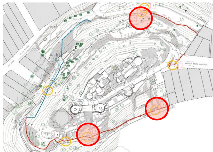
Plànol esquema tancament existent i portes i llocs on actuar