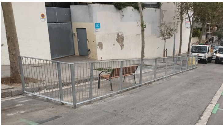
Fotografia de l'entorn escolar, setembre 2024

L'estiu de 2024 es va crear un espai d'estada, tipus entorn escolar, a l'accés de l'IES Joan Brossa. La proposta va consistir en l'anul·lació de tres places d'estacionament, i la instal·lació d'una barana metàl·lica tipus "escola" al perímetre. Als pocs dies de la seva instal·lació aquesta va ser malmesa en diferents punts (es desconeix si vandalitzada o per cops de vehicles). Es va optar per retirar el tram més afectat i es va col·locar provisionalment barreres de formigó tipus new jersey.