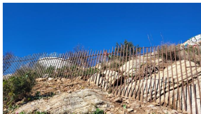
Imatge tancament perimetral existent

A tot el perímetre de la bateria antiaèria del Carmel existeix un tancat perimetral que permet poder gestionar els accessos i el tancament de l'espai museístic. Actualment aquest tancament presenta alguns punts dèbils i d'altres vandalitzats, inclosos en un informe emès per part de Guàrdia Urbana. En aquest informe es detecten dos punts pels quals accedeixen els visitants de manera irregular, i que suposen relativament accessibles a peu pla, pel que es sol·licita reforçar i prolongar el tancament existent en per tal d'evitar aquesta intrusió no desitjada.