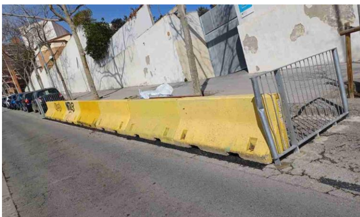
Fotografia de l'entorn escolar, març 2025

Atès les incidències produïdes, es proposa la retirada dels dos trams de barana existents i de la totalitat de les barreres de formigó, i col·locar de nou la barana inicialment instal·lada, amb la mateixa tipologia de i modulatge de barana.