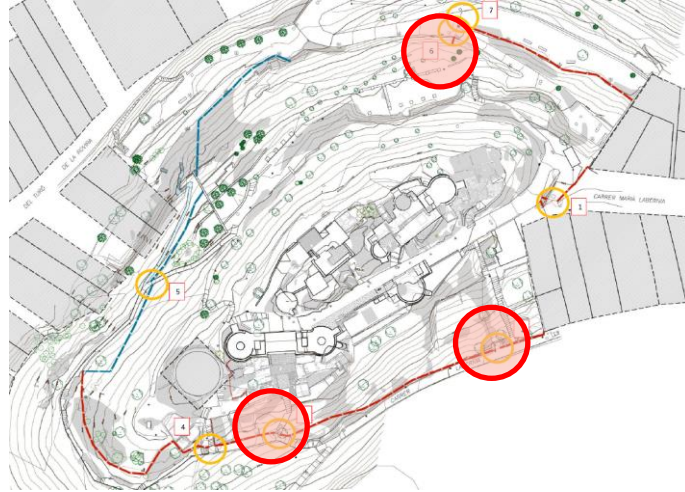
Plànol esquema tancament existent i portes i llocs on actuar