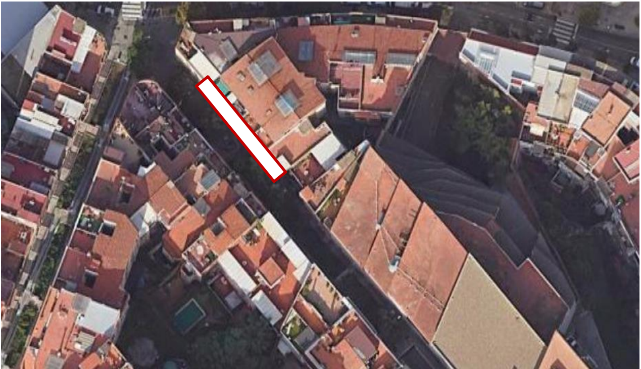
Vista aèria i zona d'actuació.