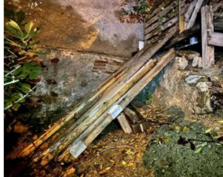
Foto 8 (feta el 13/12/24) S'observa una zona que fan servir de acumulació de material de construcció.

A data de d'avui 21/05/2025, la situació continua igual, s'han fet visites després de la confecció del present i no ha variat, ni l'entorn, ni les persones que hi viuen.