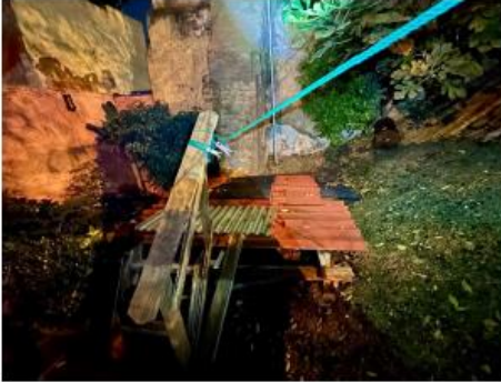
Foto 7 (feta el 13/12/24) S'observa un espai, que segons manifesta tenen previst instal·lar un nou mòdul que faria les funcions de bany.

Lepant, 387 08025 Barcelona T. 93 291 67 20 – F. 93 291 67 65 www.bcn.cat