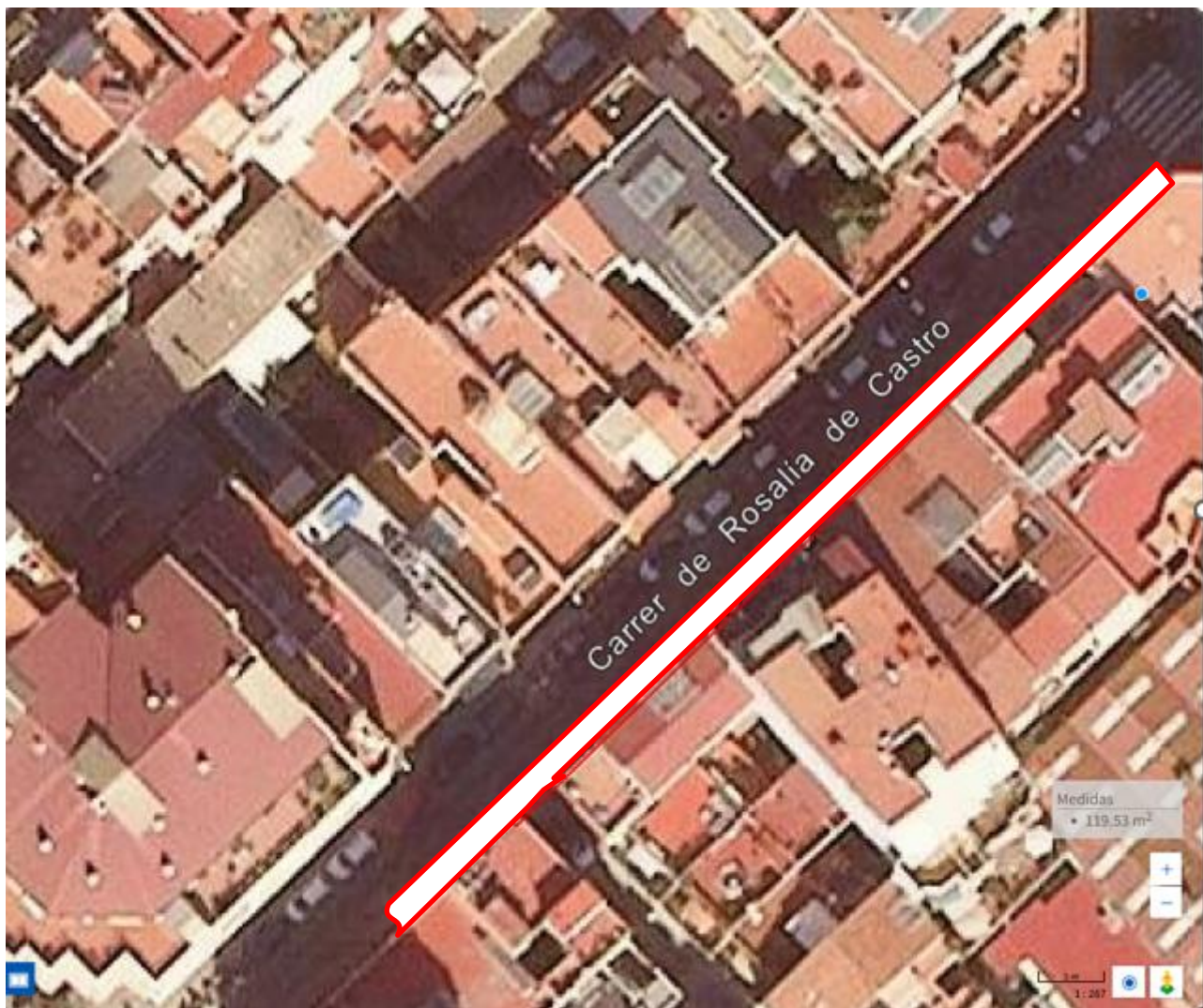
Vista aèria i zona d'actuació.