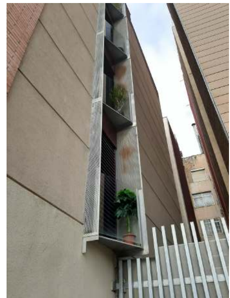
Imatges Novembre 2021