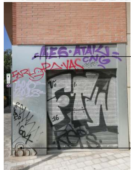
Imatges Novembre 2020