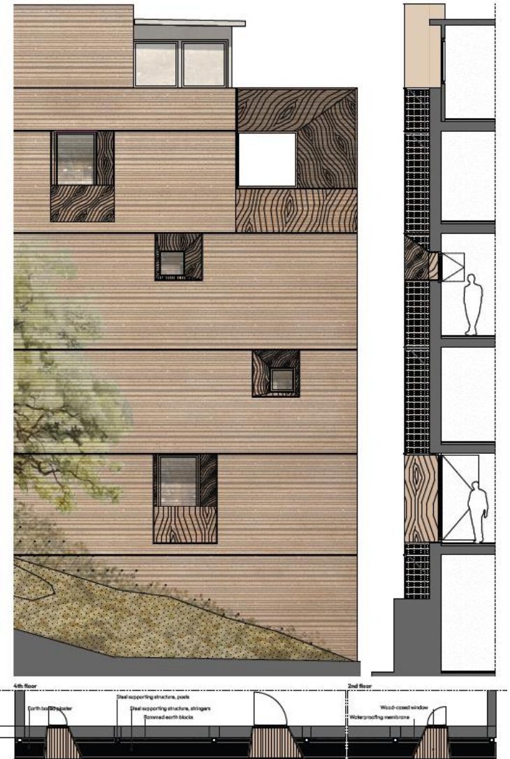
Elevation, section, plan 1:50