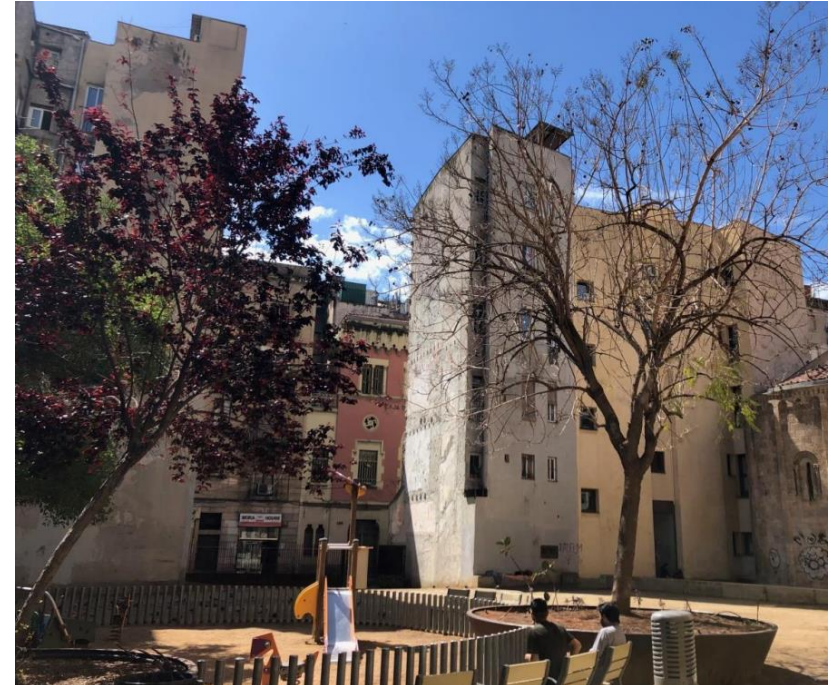
Placeta Martina Castells