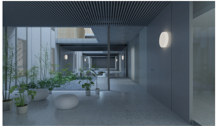
Zones comunes allotjaments temporals

A més, als espais intermedis de la planta baixa es col·loquen una sèrie de bancs individuals i modulars, de la mateixa línia i color, disposats de forma orgànica. Aquests seran fabricats en poliètil·l reciclat de baixa densitat (LDPE), amb protecció UV, tenyit en massa, amb acabat de superfície texturada amb porus tancat en color blanc. Encara que sigui possible, no es preveu la seva fixació al sòl, ja que així es garanteix que els usuaris puguin moure els elements d'acord amb les seves necessitats.