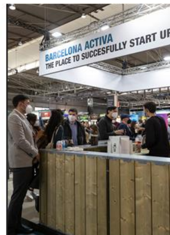
Barra / foodcorner