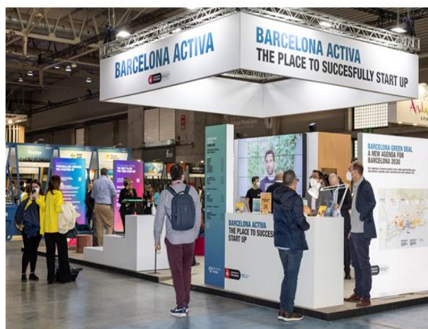
Estand 4YFN 2022