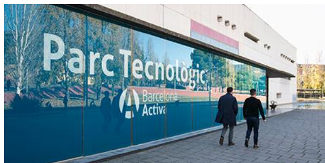
Edifici Parc Tecnològic