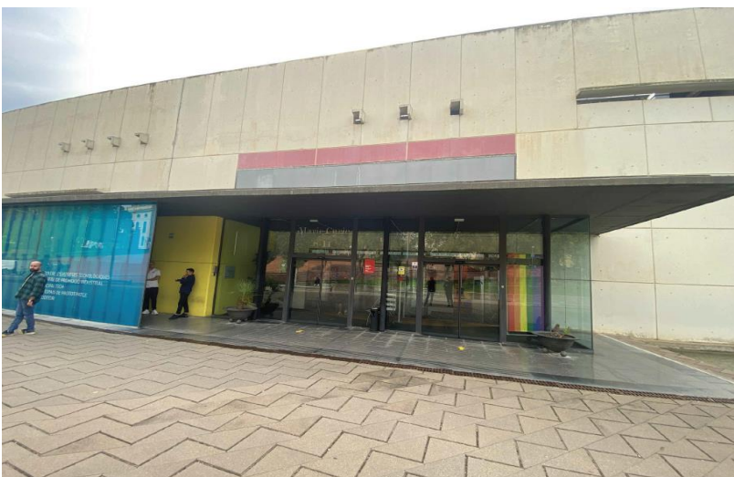
Figura 2. Accés a l'edifici del Parc Tecnològic

L'edifici del Parc Tecnològic està format per tres blocs A, B i C que estan units per dos passadissos (Nord i sud). La intervenció dels treballs es realitzarà en la zona de l'entrada principal ubicada en el c/ Marie Curie 8 – 14. El nou rètol lumínic s'instal·larà sobre el voladiu de l'entrada.