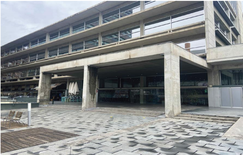
Figura 1. Accés a l'edifici de la Seu Central

L'accés a l'edifici de la Seu Central es fa a través d'una plaça interior. El nou rètol lumínic s'instal·larà al cantell de la marquesina de l'entrada de l'edifici.