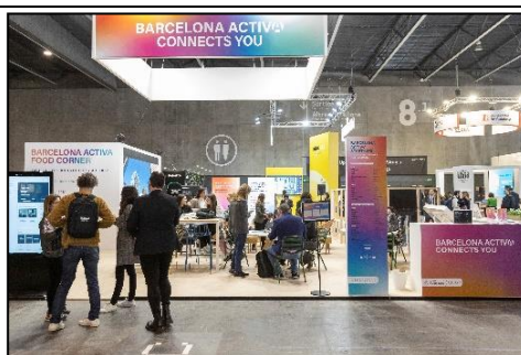
*Estand de Barcelona Activa a la fira 4YFN - MWC - febrer 2023

D'altra banda, el BizBarcelona - Saló de l'Ocupació és la fira que uneix l'oferta de solucions per a empreses, comerços i autònoms/es del saló BIZ Barcelona amb l'oferta de serveis i recursos per trobar feina del Saló de l'Ocupació. Ambdós salons se celebren enguany al mateix recinte i comparteixen alguns espais. Barcelona Activa té presència en tots els elements de comunicació, a més de liderar els comitès executius, de programa i de comunicació. Barcelona Activa organitza directament diferents espais dins del BIZBarcelona, com