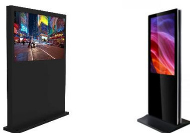
*Exemples de tòtem amb pantalla vertical i horitzontal

3.7.2. Un tòtem amb pantalla de 55 polsades com a mínim on mostrar el/s vídeo/s corporatiu/s de l'empresa, ja sigui horitzontal o vertical.