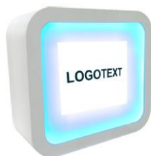
*Exemple de disseny de mostrador amb frontal il·luminat

3.7.2. Un tòtem amb pantalla de 55 polsades com a mínim on mostrar el/s vídeo/s corporatiu/s de l'empresa, ja sigui horitzontal o vertical.