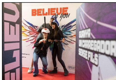
*Estand de Barcelona Activa al Saló de l'Ensenyament – març 2023