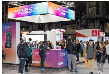
*Estand de Barcelona Activa al BizBarcelona – Saló Ocupació – novembre 2022

En tercer lloc, a la fira IoT Solutions World Congress , l'esdeveniment líder mundial en la Internet de les coses, Barcelona Activa hi participa amb un estand per donar a conèixer, principalment, els seus serveis a les empreses i acompanyar aproximadament entre 15 i 20 empreses innovadores de diversos àmbits relacionats amb aquest sector. Al 2024 segurament tindrem un estand de 200 m2 i la seva celebració està prevista entre els dies 21 i 23 de maig de l'any 2024 .