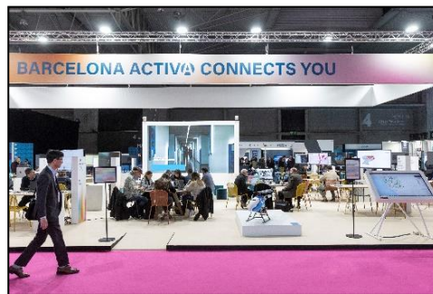
*Estand de Barcelona Activa al congrés IOT Solutions World Congress – gener 2023

Finalment, al Saló de l'Ensenyament , Barcelona Activa està present en un estand annex al de Joventut d'Ajuntament, oferint assessorament i informació sobre els serveis de formació i ocupació per a joves. L'estand en aquest cas és bastant més petit i senzill, acostuma a ser d'un màxim de 25m2. La seva celebració està prevista del 13 al 17 de març del 2024 .