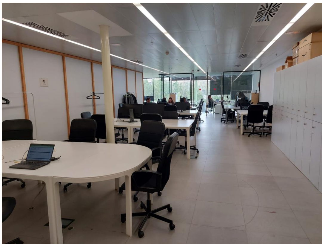
Fotografia 3: Futura sala esdeveniments.