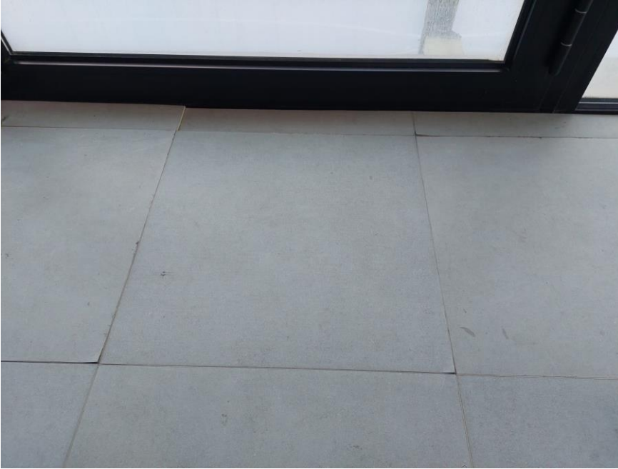
Fotografia 15: peces malmeses i crestejades.