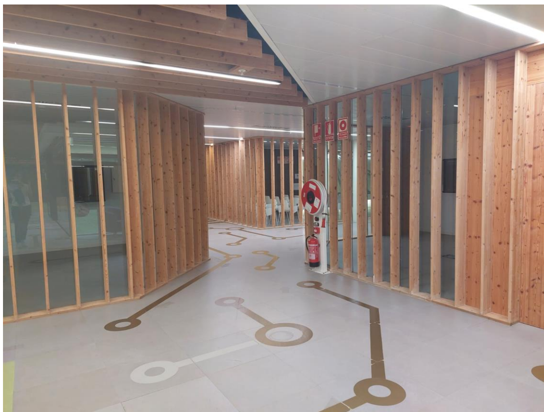
Fotografia 6 i 7 : Passadissos espai Lidera