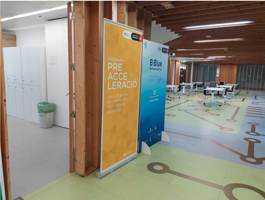
Fotografia 2: Accés sala esdeveniments.