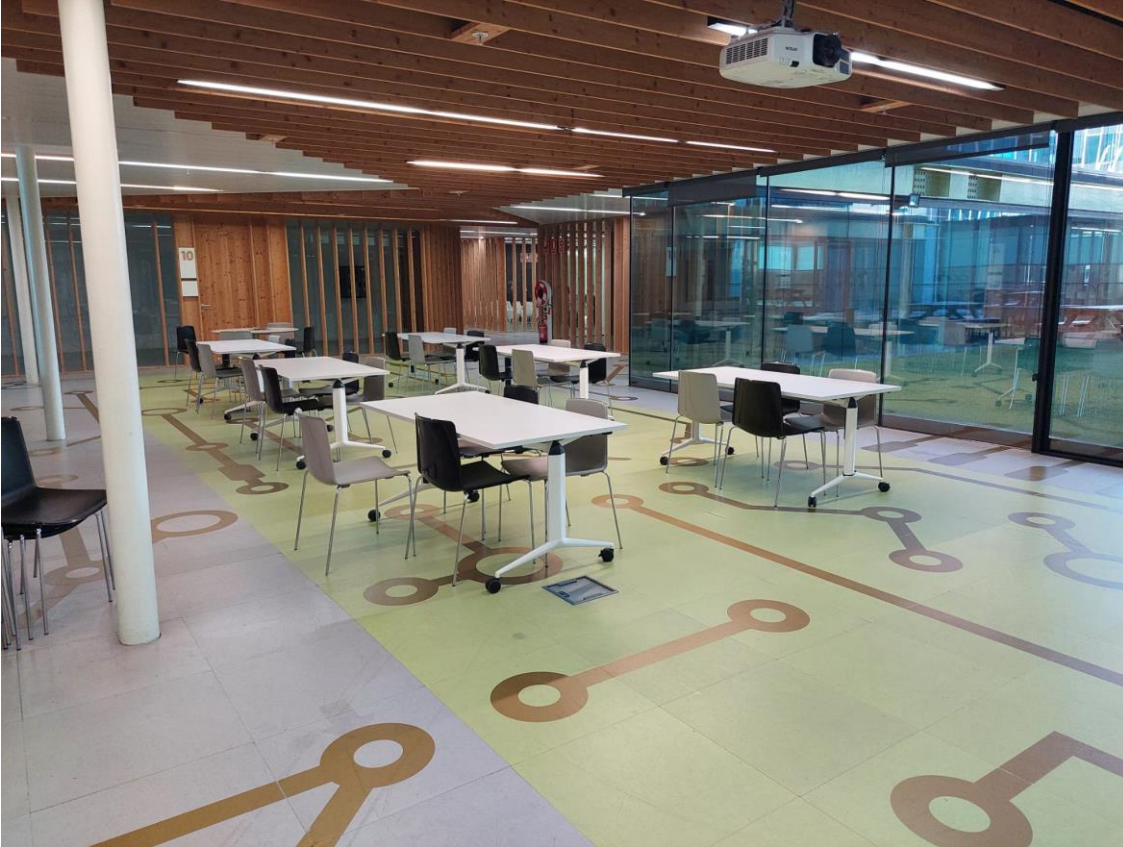
Fotografia 4 i 5 : Espai comú Lidera