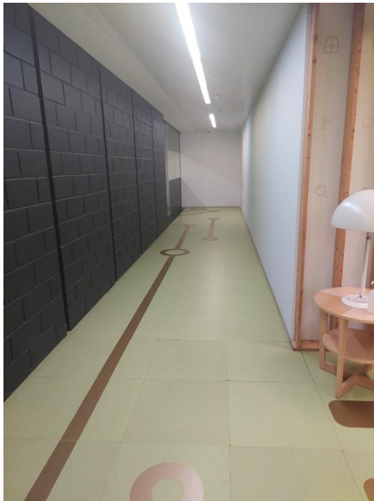
Fotografia 10,11 i 12: Passadissos als costats del nucli d'ascensors, sobre els que no s'instal·larà nou vinílic, però sí que es mouran peces verdes en bon estat, i les que tenen vinil daurat es desplaçaran sota la zona de nou vinílic.