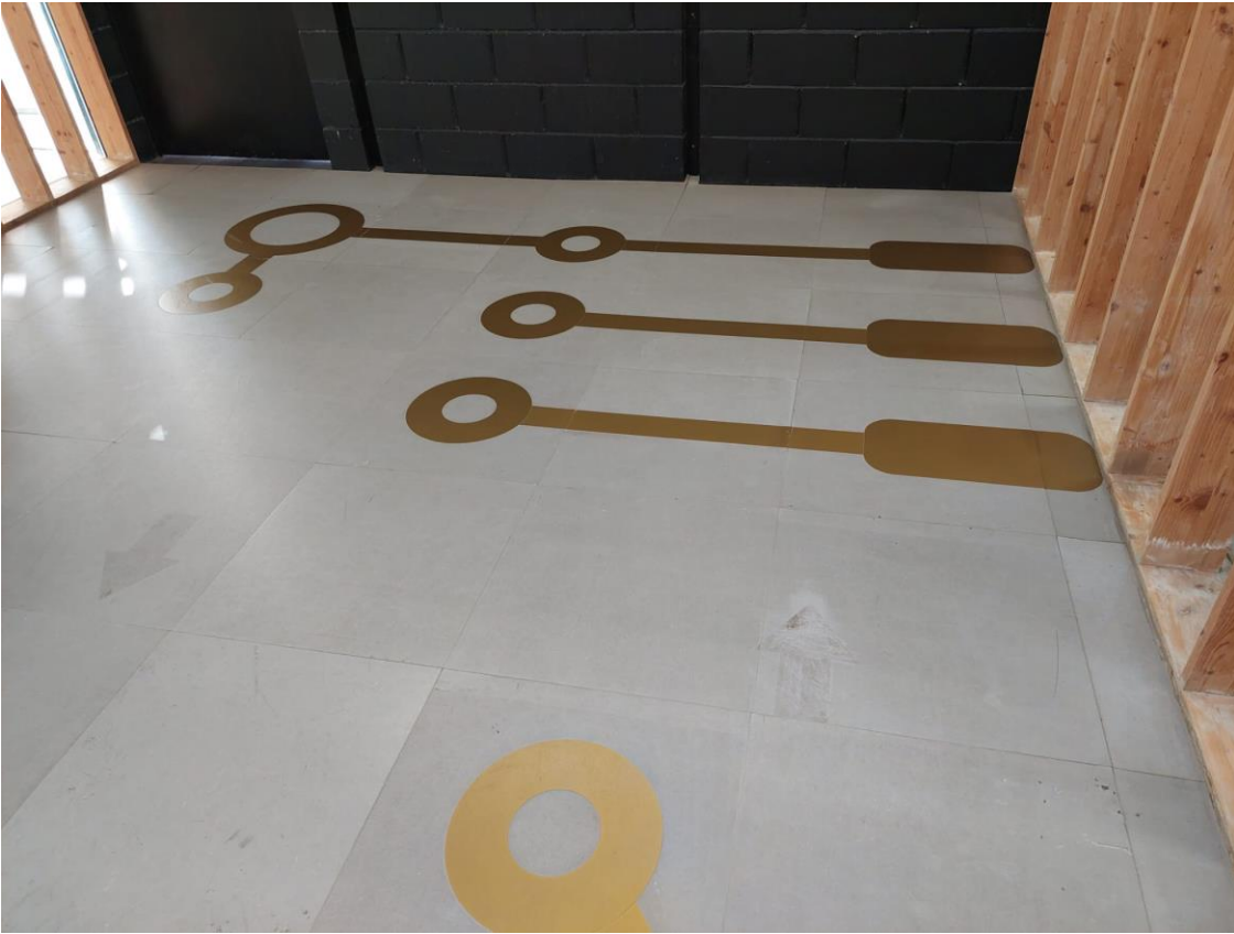
Fotografia 8 i 9 : Passadissos espai Lidera