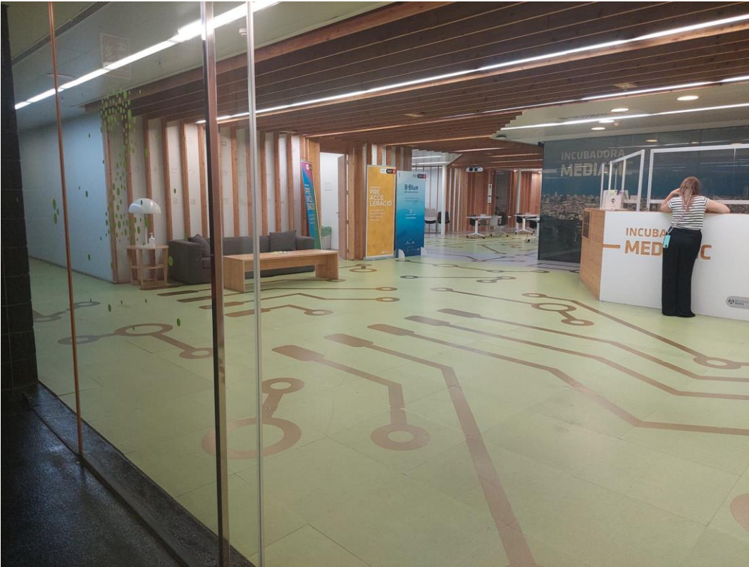
Fotografia 1: Recepció futur espai Lidera, vist des del nucli d'ascensors.