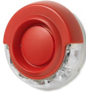
Sirena amb flax

La configuració, programació i posta en marxa de la nova instal·lació la realitzarà el servei tècnic oficial de Siemens.