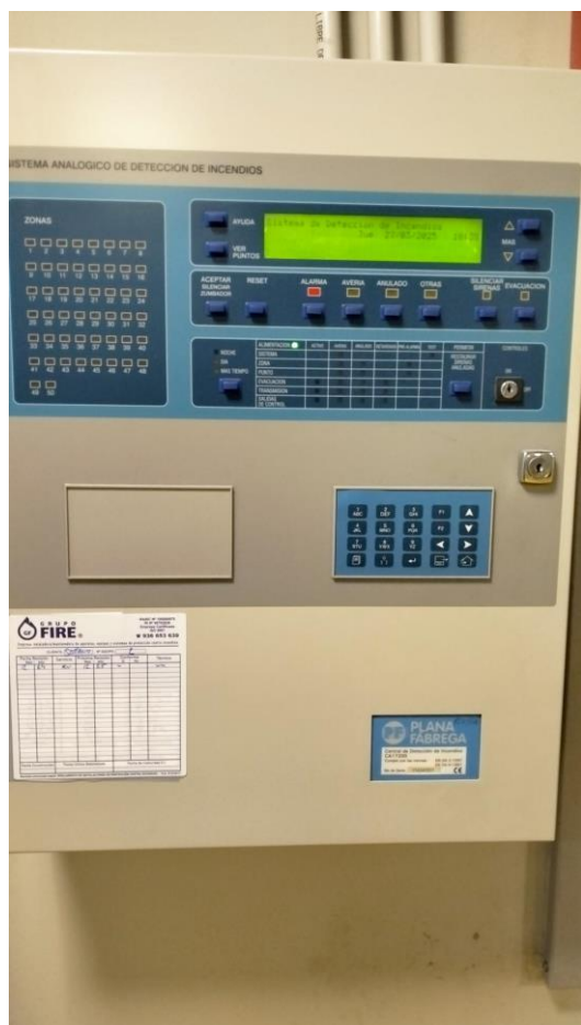
Central Plana Fàbrega

Quan es fa fer la reforma en la planta -1, la central que hi havia en l'edifici, Siemens CC1142, no permetia cap tipus d'ampliació pel que es va optar per instal·lar una central addicional que es connectés amb l'existent mitjançant un mòdul de comunicació. L'any 2018 es va substituir la central Siemens CC1142 per la central actual Siemens Sintesco.