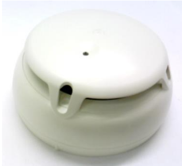
Detector de fum