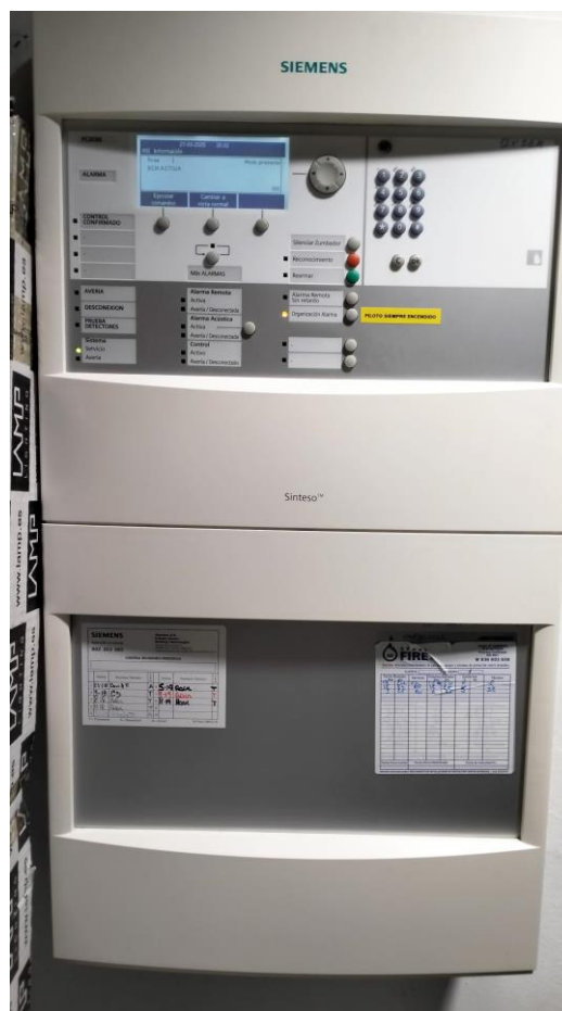
Central Siemens Sintesco