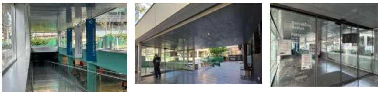
Planta a nivell del carrer

Aquest criteri es valorarà fins a un màxim de 15 punts , d'acord amb el barem següent: