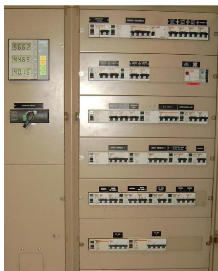
Quadre proteccions Clima