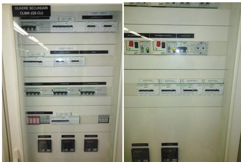
Quadre proteccions Clima - 1 1