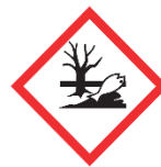
GHS09 Peligroso para el medio ambiente

En caso de que las empresas adjudicatarias deban hacer uso de productos químicos durante la realización de los trabajos, será de total aplicación el Real Decreto 374/2001. Se hará hincapié en los siguientes aspectos: