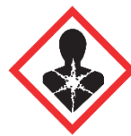
GH08 Cancerígenos, mutágenos, teratógenos