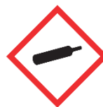
GHS04 Gases Comprimidos