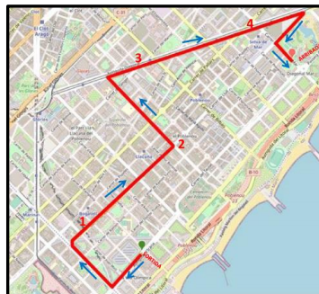
CIRCUIT CURSA INTERNACIONAL 5K

La Cursa dels Nassos Internacional es troba present al calendari de competicions del 2023 de la World Athletics (Federació Internacional d'Atletisme)