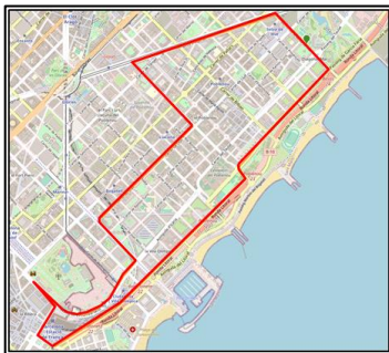
CIRCUIT CURSA POPULAR 10K

La Cursa dels Nassos internacional 2023, restringida a atletes professionals, se celebrarà a continuació, o abans, de la Cursa dels Nassos popular de 10K Els circuits de cadascuna de les curses són els que reflecteixen els gràfics següents