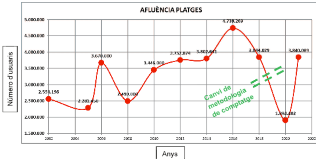
Figura 2. Afluència de les platges de Barcelona (anys 2002-2022). Noteu que a partir de l'any 2020 s'ha canviat la metodologia de comptatge d'usuaris de les platges. Per aquest motiu, les dades amb anys anteriors no són directament comparables.

Són també un espai molt atractiu per a la realització d'actes de naturalesa molt diversa (esportius, filmacions, actes de districte, estudis, etc.).