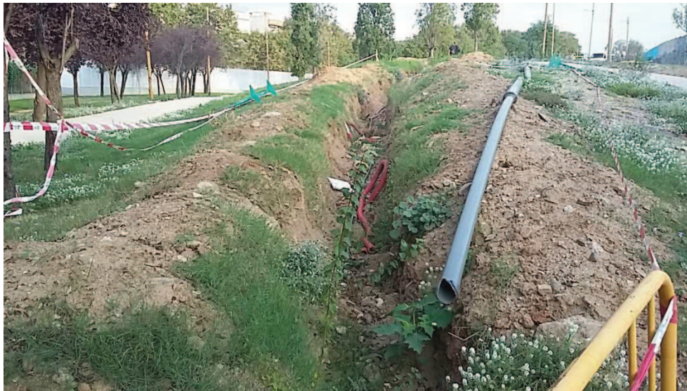
Estat del parterre zona Calistenia amb rasa oberta, (actualment la rasa està tapada)

En un dels parterres de les zones annexes al Parc de la Trinitat concretament al costat del carrer de Via Bàrcino, i a prop de la zona d'elements de gimnàs de calistènia va ser necessari substituir la canonada primària de reg que era molt antiga i de pvc perquè esta deteriorada i tenia moltes fuites que es repartien en tot aquest tram de canonada d'uns 110 m de llargada.