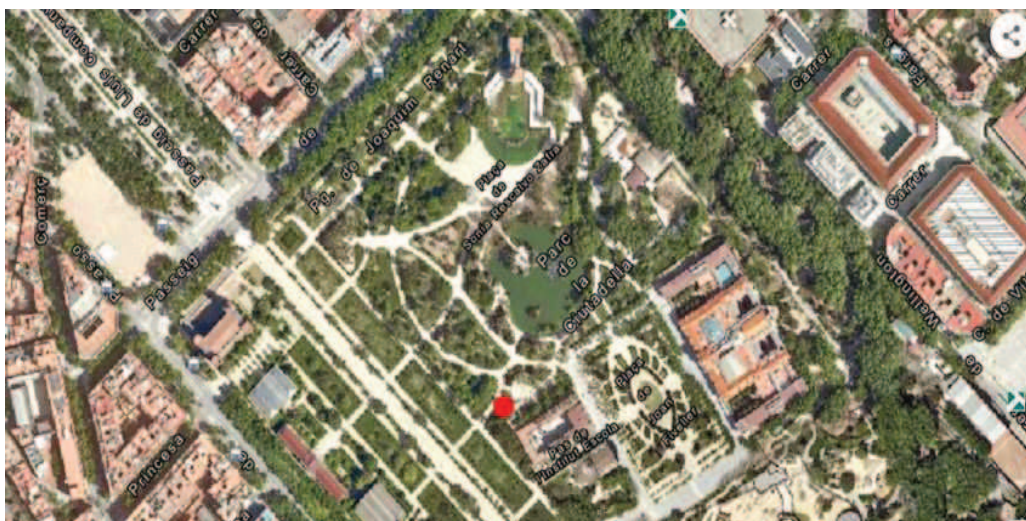
Punt d'actuació en el Parc de la Ciutadella

Durant les obres de la placa Joan Fiveller es van re-estructurar els sectors de reg de la mateixa, passant dels 11 existents a 16 i des de l'obra es va pretendre aprofitar el cablejat que arribava a la plaça (4 cables de 5 fils).