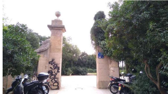
Zona 2: mur colindant al portal d'accés a finca costat baixada c. Desert de Sarrià.