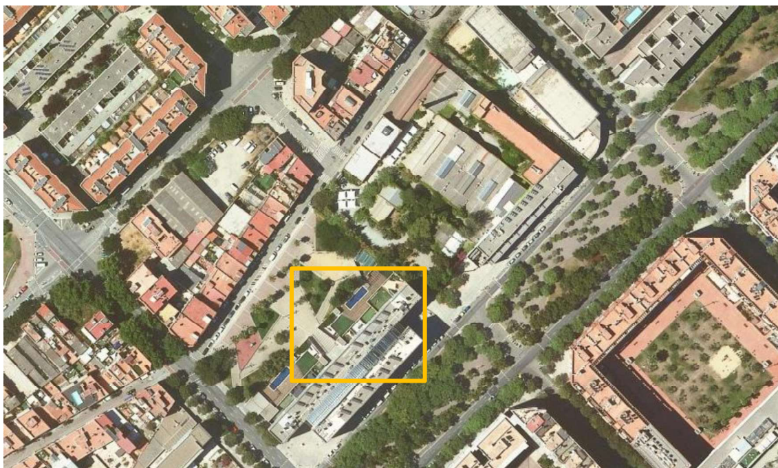
Figura 1. Situació de l'emplaçament

L'àmbit del present plec es situa en els Jardins Remedios Varó i la zona exterior de la finca adjacent de Palo Alto, que es troben a la illa delimitada pel Passeig de Taulat, el carrer Bac de Roda, el carrer de Pellaies i el carrer dels Ferrers.