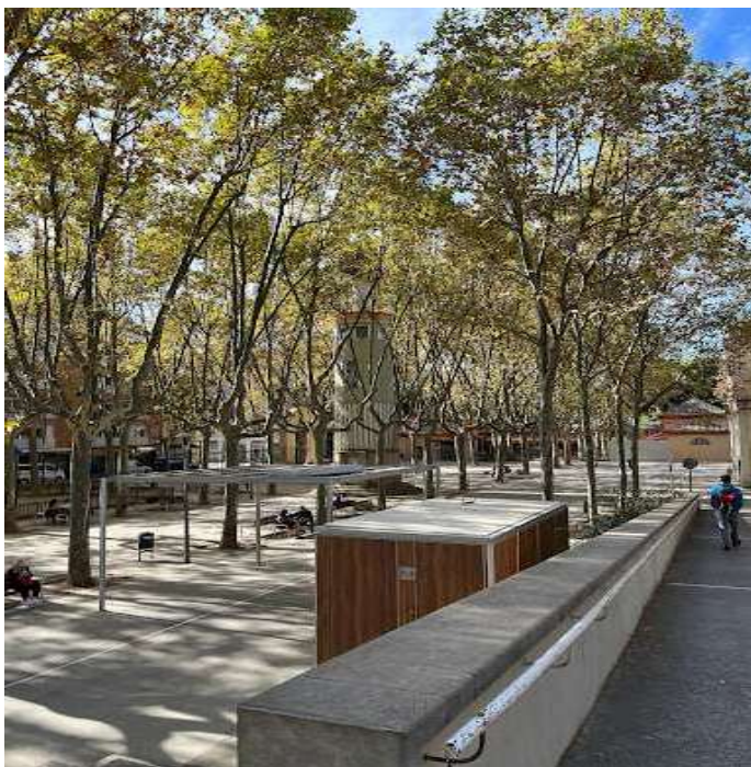
Ubicació de la nova guingueta amb la pèrgola situada en la zona de jardí front el espai de joc infantil que es troba entrant per la porta el carrer Muntadas ( Accés al parc que hi ha al costat de l'escola Joan Pelegrí.)