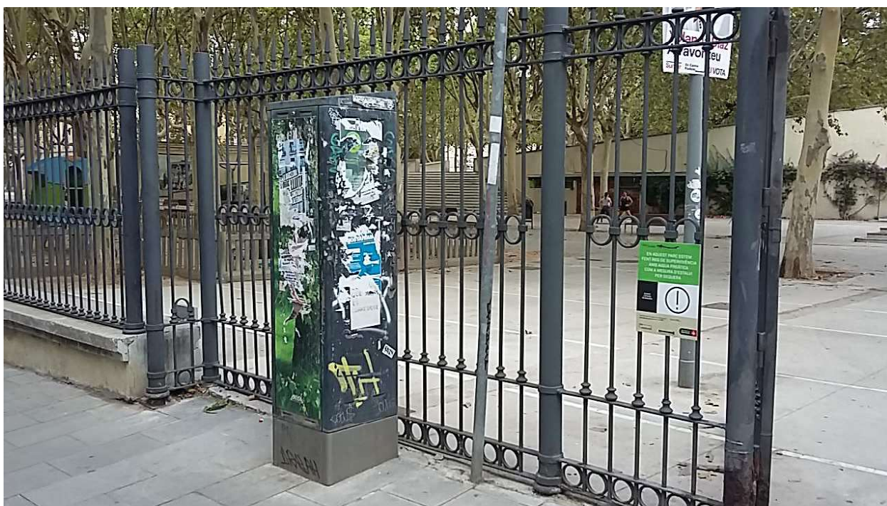
Ubicació de l'armari elèctric existent per instal·lar el comptador.

Els treballs es realitzaran complint els criteris de la normativa vigent del reglament de baixa tensió, i es descriu el traçat des del punt de connexió del subministrament que determina endesa i a on s'instal·larà el comptador en el armari elèctric existent.