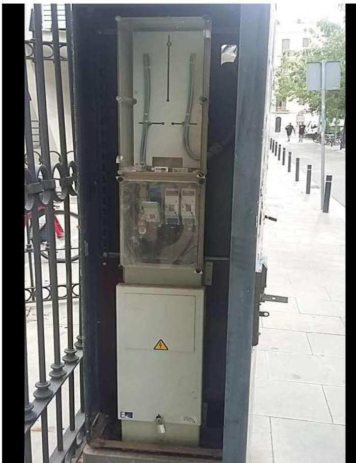
Interior de l'armari existent ( situat al cotat de la porta del carrer Muntadas)