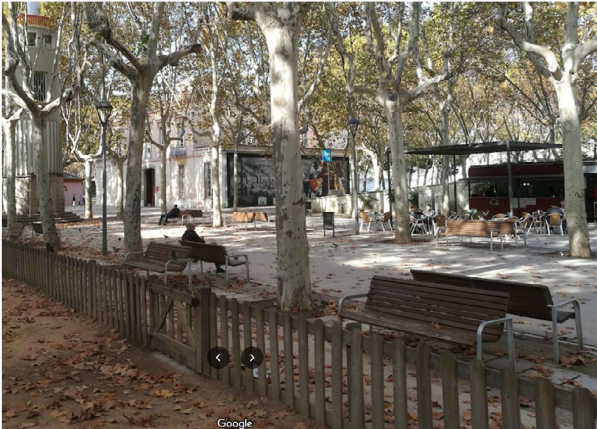
UBICACIÓ DE LA GUINGUETA – BAR DEVANT DEL LA ZONA DE JOC INFANTIL