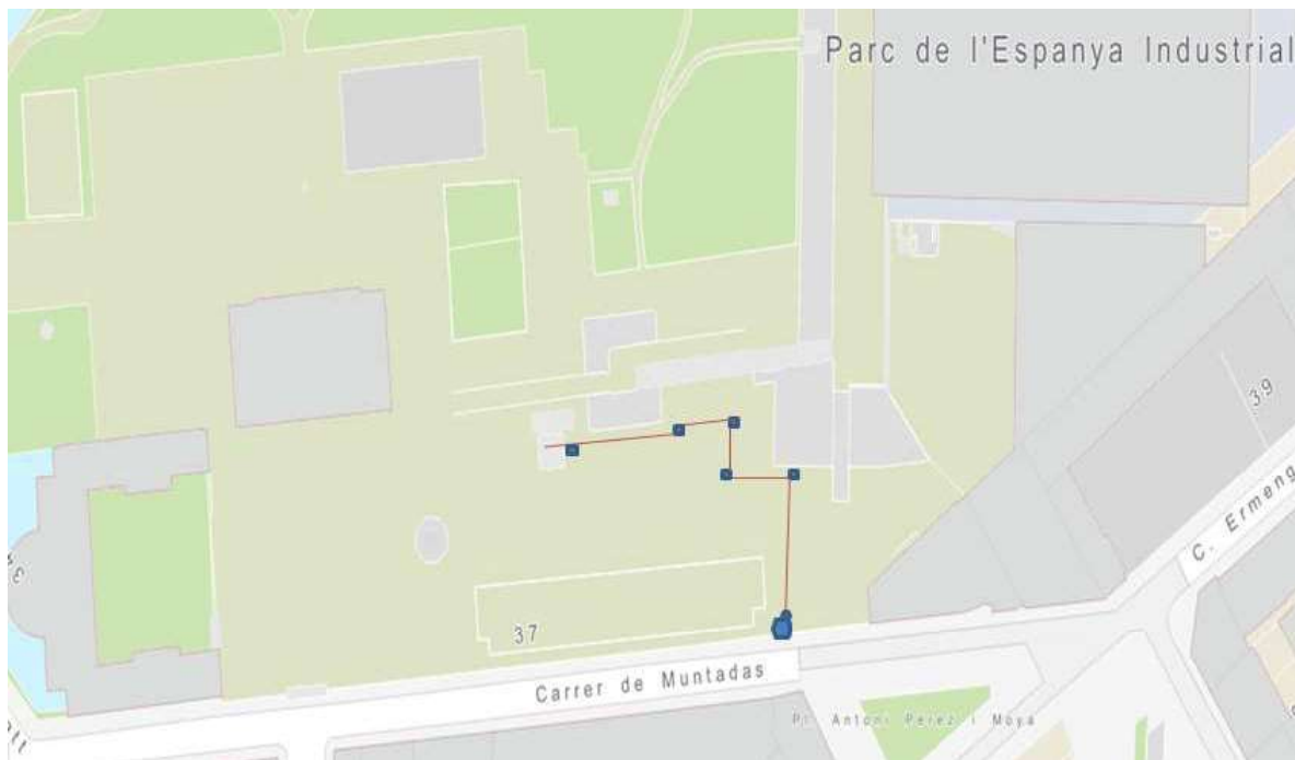
Zona d'actuació en el Parc