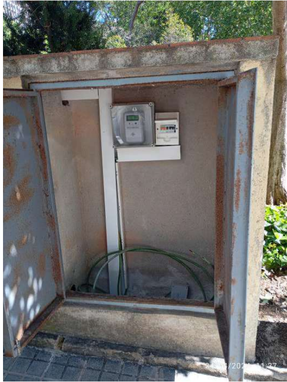
Foto 2 comptador Propietat Parcs i jardins