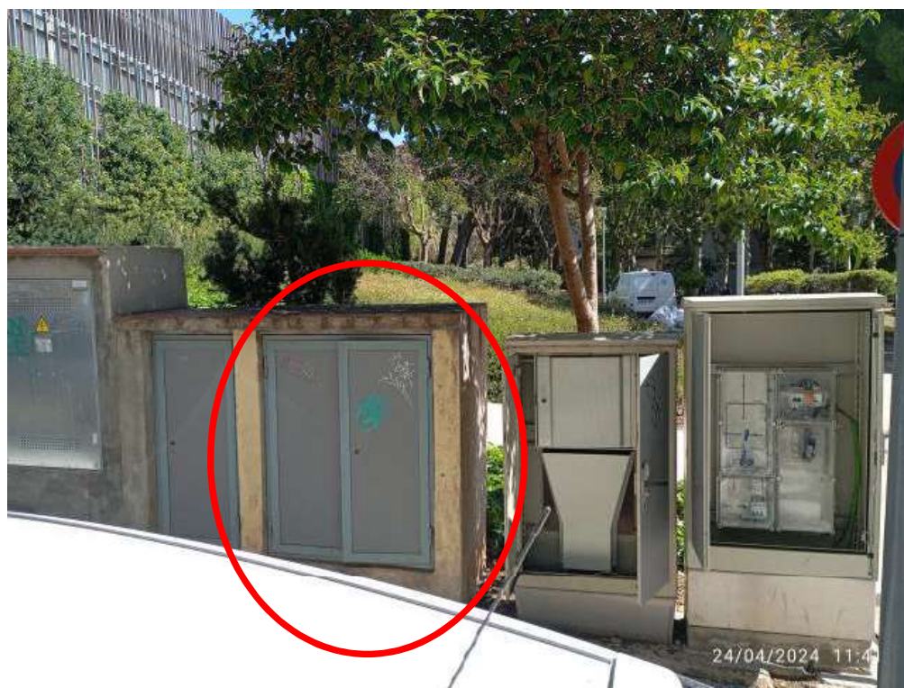
Foto 1 Armari amb comptador Propietat Parcs i jardins

També cal verificar si el cable pot passar pels tubs existents o cal fer una petita rasa per comunicar els armaris.