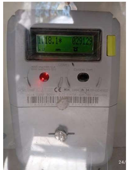
Foto 3 comptador Propietat Parcs i jardins